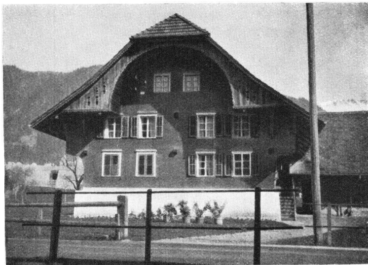
Abb. 8. Emmentaler Typus mit Rundbogen. — Fig. 8. Type emmentalois avec un pignon arrondi.