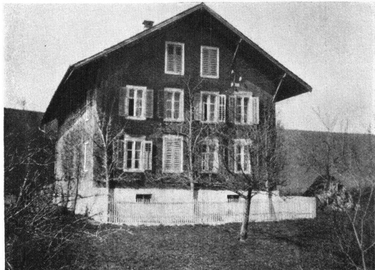
Abb. 12. Neuere, stillose Bauweise. — Fig. 12. Architecture moderne sans aucun style.

Alle die vielen Bauernhäuser, die sich nicht in einen der vorgenannten Baustile hineinfügen, sind umgebaute Wohnungen, an denen die ursprüngliche Form kaum mehr zu erkennen ist. Pfarrer Schnyder von Wartensee, gest. 1784, hat sich seinerzeit bemüht, Vorschriften und Pläne für praktische Bauernhäuser zu entwerfen, seine diesbezüglichen Arbeiten sind unveröffentlicht geblieben. Wir schliessen mit