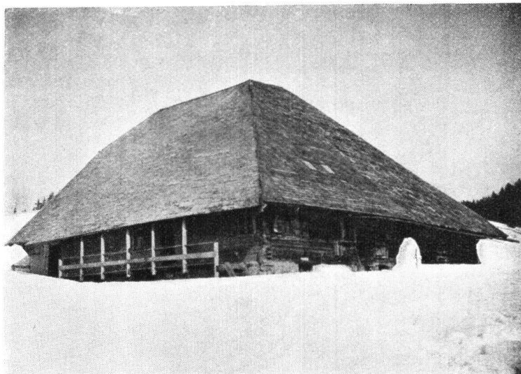
Abb. 1. Alphütte im Entlebuch. — Fig. 1. Chalet alpestre dans l'Entlebuch.

Es war einmal die Zeit der alten Schweiz, ihr Name hatte einen guten Klang bei den Nachbarn ob ihrer Eigenkraft und nationalen Eigenart als Alpenland; heute ist diese Schweiz übergegangen an die internationale, alle Unterschiede verwischende Mode, die Eigenart hat sich in einige Gebirgstäler zurückgezogen, um allhier noch ein kümmerliches Dasein zu fristen. Ueber die Häupter unserer Alpenwelt, die allein noch zu trutzen wagt, schreitet modern London und Paris und die neue Welt. — Und wie es dem Mutterlande ergangen, so erging es der kleinen Tochter, dem wahrhaftigen Ebenbilde, dem Entlebuch. Noch Alpen- und Aelplerland bis ins 19. Jahrhundert hinein, hat das Entlebuch seinen früheren Charakter verloren. Wo sind die Alpen mit der Alpkäserei? Heute sind es moderne Genossenschaftsalpen für Jungvieh und gehören nicht einmal Entlebuchern. Wer sieht noch einen schönen Alpaufzug, die Kühe mit mächtigen Gunglen am majestätischen Halsband, der Muni mit dem prächtigen Mejen auf dem Kopfe? Der Sonntagsstaat, die Männer, alt und jung hemdärmelig, die Mutter und Töchter in schmucker Landestracht, ist uns aus der Knabenzeit noch erinnerlich, wir haben's noch selber mitangesehen. Der hölzerne Pflug, bestehend aus Geize, Grendel und