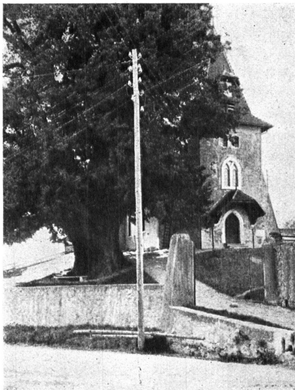
Abb. 15. Die siebenhundertjährige Linde in einem Waadtländer Dorf, durch Telefonleitungen und -stange verunstaltet. — Fig. 15. Tilleul sept fois centenaire d'un village vaudois, enlaidi par le voisinage d'un énorme poteau des télégraphes et téléphones.

Reinhalten der Gewässer und der Atmosphäre. Unser vielgepriesener blauer Zürichsee leidet bekanntlich unter der starken Verunreinigung durch Abwasser aus allen möglichen Zuleitungen. Die öffentlichen Organe haben sich mit diesen Uebelständen aus Gründen des Heimat- und Naturschutzes, und mit Rücksicht auf die sich mehrende Entnahme von Wasser zu Trinkzwecken, sowie auf die Erhaltung und Förderung des Fischbestandes schon beschäftigt. Verschiedentlich sind schon am Zürichsee, so in Wädenswil, Massnahmen der obersten kantonalen Behörden notwendig geworden zur strikten