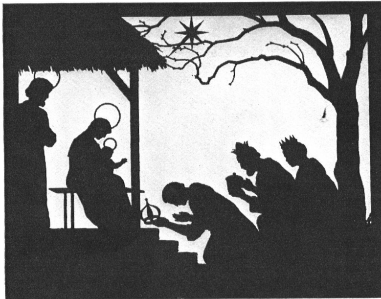
Abb. 15. Schattenbild «Dreikönige». Ebenfalls verkleinerte Wiedergabe aus «Der Stern von Bethlehem» (Im Rotapfelverlag, Erlenbach-Zürich). — Fig. 15. Silhouette: «Les trois Rois». Reproduction réduite d'une composition extraite de «l'Etoile de Noël». Edition Rotapfel, Erlenbach-Zürich.