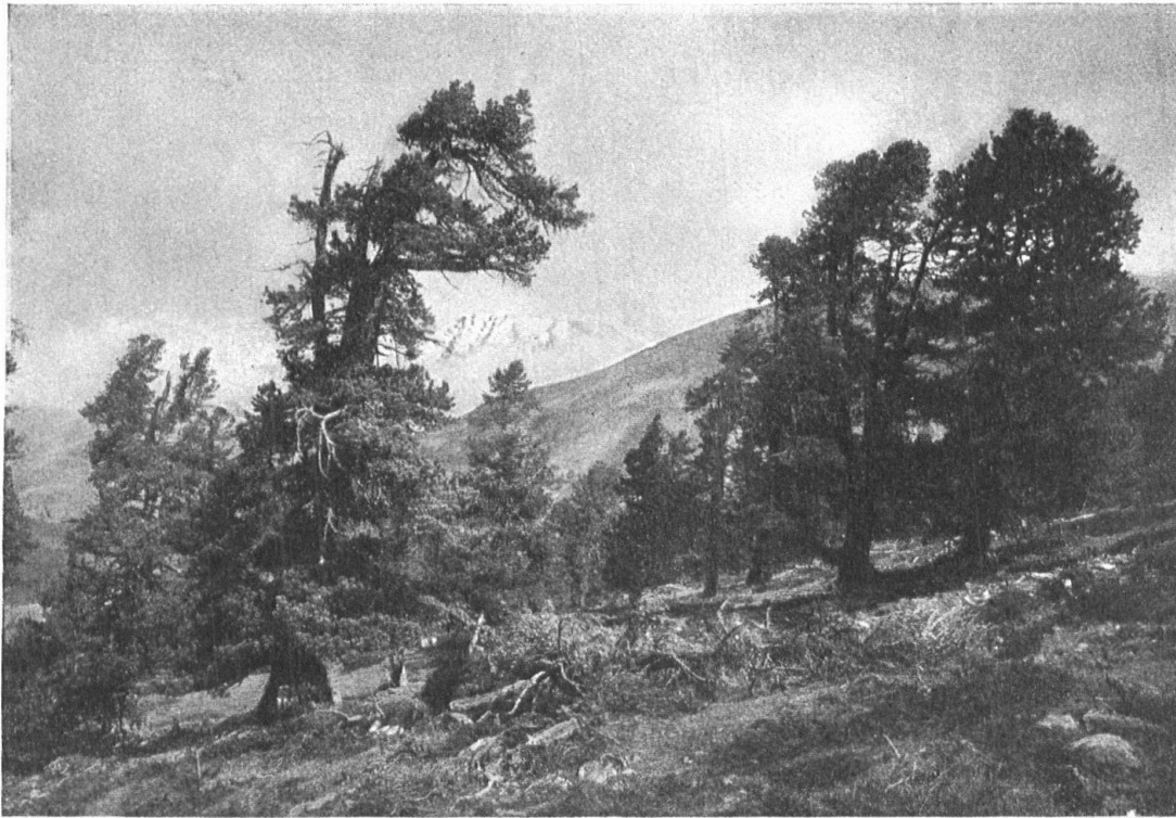
Abb. 5. Arven und Föhren im Nationalpark. Photographie von J. Feuerstein, Schuls. — Fig. 5. Arolles et pins dans le Parc national. Cliché de J. Feuerstein, Schuls

zu erreichen, mehr noch: um unsere Schweizerjugend wieder zurückzuführen zu den Quellen, aus denen unsere Väter Gesundheit und Kraft geschöpft haben, erschien kein Mittel geeigneter, als ihr die Augen zu öffnen über die Gefahren, die die Entweihung unserer Allmutter und die gewinnsüchtige Ausbeute ihrer Schätze mit sich bringt.