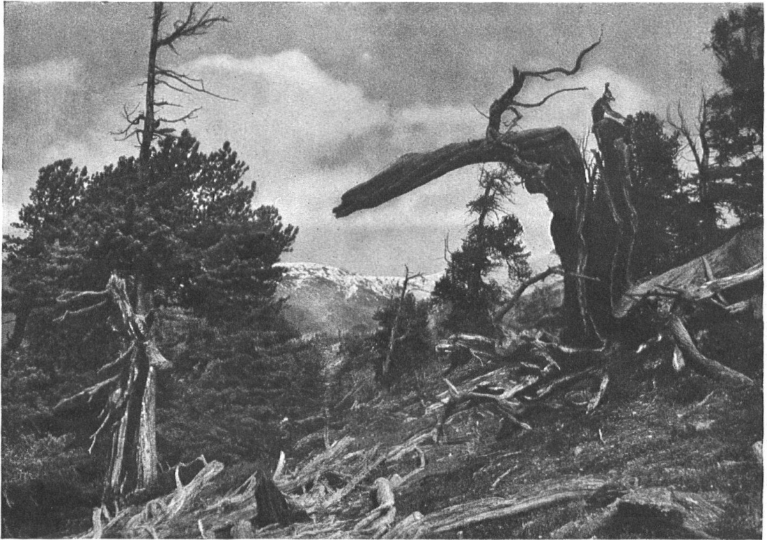
Abb. 6. Urwald im Nationalpark. — Fig. 6. Forêt vierge dans le Parc national.

der landschaftlichen Naturschönheiten“ und einer weitem: „Schutz der einheimischen Tier- und Pflanzenwelt vor Ausrottung“. Während die Naturforscher und die weiten Volkskreise, die sich um sie scharten, sich mit bewundernswerter Energie den grossen Arbeiten widmeten, die Dr. S. Brunies in seinem Artikel kurz skizziert, ist der Heimatschutz mit Belehrung, mit Protest oder mit Ratschlag und materieller Unterstützung eingetreten, in zahllosen Einzelfällen, wo landschaftlichen Naturschönheiten Entstellung und gewinnsüchtige Ausbeutung drohte. Mit dem Schutz der Pierre des Marmettes, des Stazer Waldes, des Matterhorns begann recht eigentlich die Heimatschutzarbeit; Diablerets, Silsersee, Sempachersee folgten, um nur einige Naturdenkmäler zu nennen, für deren Erhaltung der Heimatschutz kämpfte und weiter kämpfen wird. Dann die Bestrebung zum Schutze einzelner Bäume, zur guten Gestaltung von Anlagen, Friedhöfen und Meliorationen; der, auch gesetzlich festgelegte, Landschaftsschutz gegen grobe Uebergriffe von Wasserwerken, der Kampf gegen unnötige oder unschön geführte Freileitungen für Schwach- und Starkstrom. All das gehört zu dem grossen Arbeitsgebiet des Natur- und Heimatschutzes, und manche dieser Aufgaben sind vom Heimatschutz allein, andere vom Heimatschutz und Naturschutz gemeinsam übernommen worden. Das