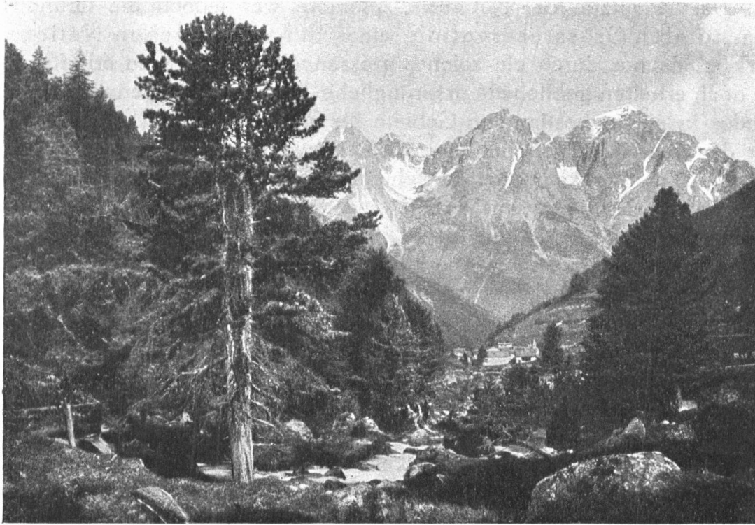
Abb. 2. Scarl mit Pisoc im Hintergrund. — Fig. 2. Scarl et le Pisoc.

wichtiger Naturdenkmäler ernannt. Zugleich wurden in den einzelnen Kantonen Subkommissionen gebildet, deren Aufgabe es zunächst war, Inventare der zu schützenden Naturdenkmäler anzulegen. Kurz zuvor war die Schweizerische Vereinigung für Heimatschutz ins Leben gerufen worden, die, neben der Erhaltung der Eigenart in der überlieferten Bauweise, in Sitten und Gebräuchen, den Schutz der landschaftlichen Naturschönheiten vor jeder Art der Entstellung und gewinnsüchtiger Ausbeute, wie auch den Schutz einheimischer Pflanzen und Tiere vor der Ausrottung zum Ziele hat. Mit Hilfe verschiedener kantonaler Naturforschenden Gesellschaften, der Vereinigung für Heimatschutz, des Schweiz. Forstvereins, des ornithol. Vereins, privater Gesellschaften u. a. m. gelang es, eine grosse Zahl von Findlingsblöcken, ferner mehrere vorgeschichtliche Stätten und erhaltungswürdige Bäume für immer zu schützen. Im Verein mit dem Heimatschutz konnte schon vor einem Jahrzehnt die Entstellung des Silsersees verhindert werden (Crotes Kraftwerkprojekt). In 19 Kantonen wurden Pflanzenschutzgesetze eingeführt. Des fernern konnten in der Folge eine erfreuliche Anzahl von Schutzgebieten (forstliche, botanische, ornithologische und totale Reservate) ins Leben gerufen werden.