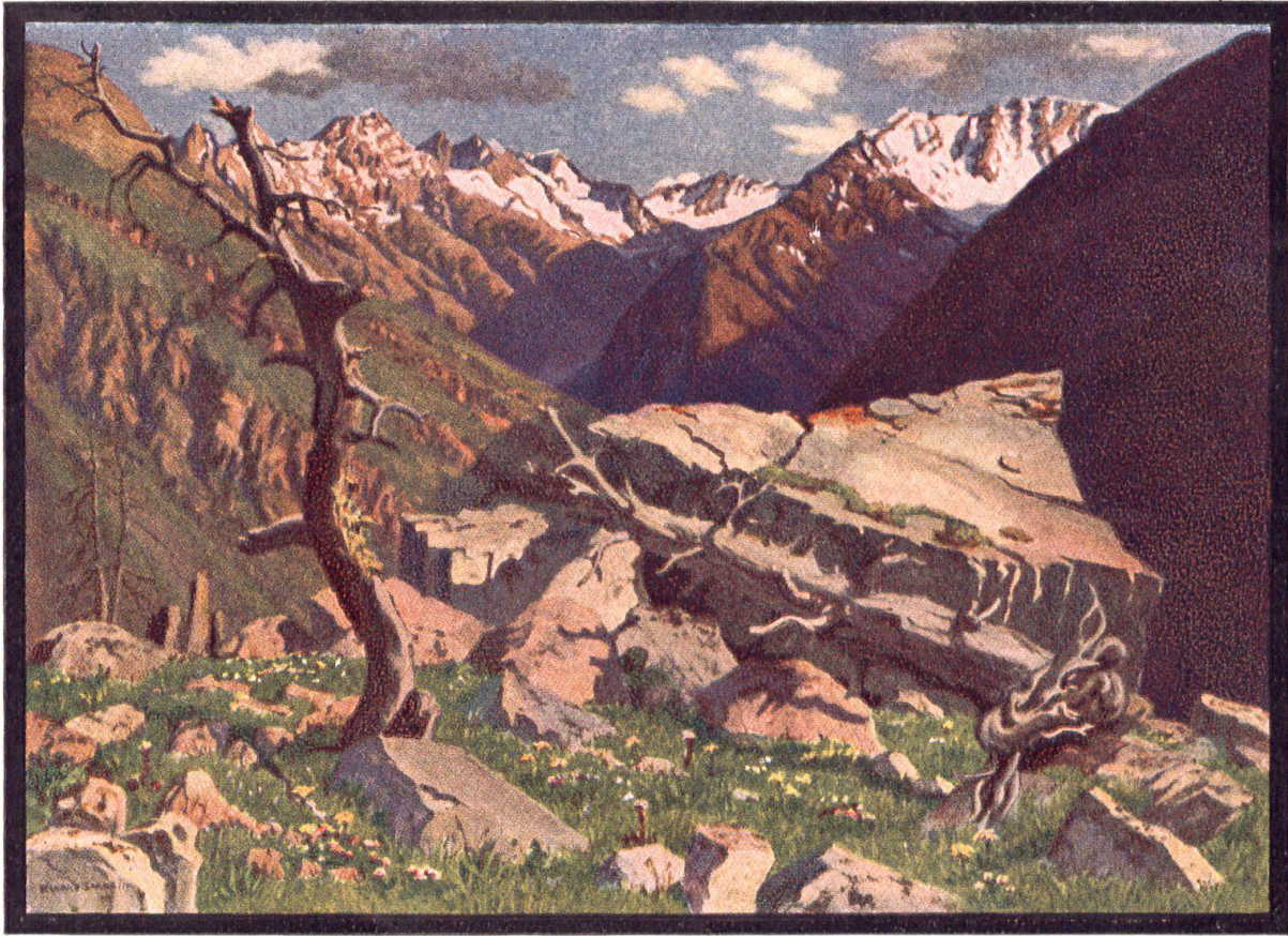
VAL CLUOZA MIT DEN SEITENTÄLERN VAL DEL DIAVEL UND VAL SASSA