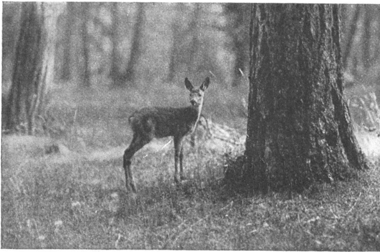
Abb. 4. Junges Reh im Nationalpark. — Fig. 4. Jeune chevreuil dans le Parc national.

Reich, Jung und Alt zu freudiger Mitarbeit heranzuziehen. Zu diesem Zwecke wurde 1909 ein Schweizerischer Bund für Naturschutz gegründet, dem jeder angehören kann, der jährlich mindestens 1 Fr. (jetzt 2 Franken) oder einmalig 20 Fr. (jetzt 50 Franken) entrichtet.