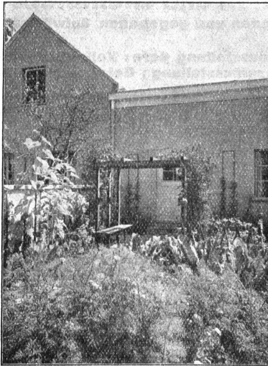
Arbeitergärtchen mit Sitzlaube

OTTO FRÖBEL'S ERBEN Gartenarchitekten Zürich 7