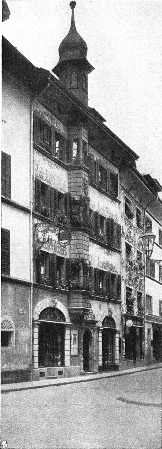
Abb. 9. Fassade des Bossard'schen Hauses an der Weggigasse zu Luzern. Eines der schönsten alten Patrizierhäuser der Schweiz; sein drohender Abbruch sollte verhindert werden. — Fig. 9. Façade de la maison Bossard à Lucerne (Weggigasse). Une des plus belles des vieilles maisons patriciennes suisses. Elle mériterait d'échapper à sa démolition imminente.