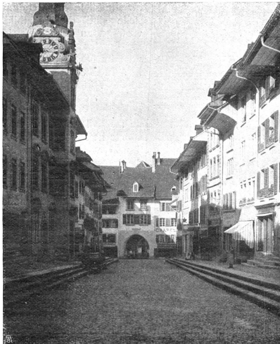
==== Blick nach dem Durchbruch der Rathausgasse zur Bahnhofstrasse ==== L'arcade conduisant de la rue de l'Hôtel de ville à celle de la gare

AVIS. Pour répondre au désir qui nous a été exprimé à maintes reprises, notre journal sera, dès janvier 1910, envoyé directement à nos membres à leur adresse personnelle. Nous prions donc nos membres de vouloir bien vérifier attentivement les adresses et de donner immédiatement avis au Bureau du Heimatschutz, à Berne, des erreurs qui auraient pu se produire.