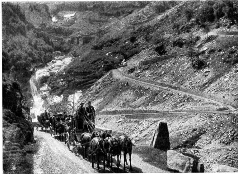
== DIE FURKAPOST IN DEN SCHÖLLENEN – LAPOSTE DE LA FURKA DANS LES SCHÖLLENEN == Aufnahme vom Photographie-Verlag Wehrli A.-G. in Klichberg bei Zürich ==

Das Konzessionsgesuch für die Matterhornbahn wird, wie der „Liberté“ geschrieben wird, dem Grossen Rate des Kantons Wallis erst im November vorgelegt werden. Die Akten befinden sich noch beim Departement der öffentlichen Arbeiten; dieses will zuerst umfassende Erhebungen anstellen, bevor es sich über das vielbestrittene Projekt ausspricht, und hat deshalb die öffentliche Behandlung