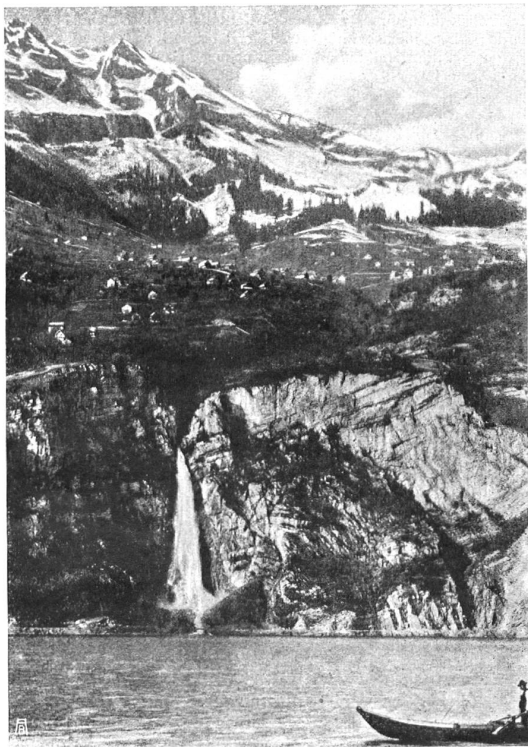
ANSICHT DES MUSLENFALLS an der Bätliserstrasse bei Amden vom Wallensee aus. Der Wasserfall wird trotz aller Proteste durch ein Elektrizitätswerk ausgenützt und somit wahrscheinlich bald in seiner Wirkung beeinträchtigt werden