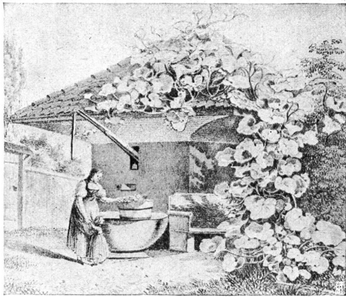
EHEMALIGES BRUNNENHÄUSCHEN IN EINEM GARTEN ZU BERN ANCIENNE MAISONNETTE DE PUIITS DANS UN JARDIN DE BERNE ALTE RADIERUNG — VIEILLE EAU-FORTE