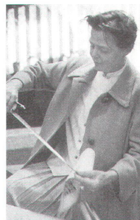
Charlotte Perriand en 1958 et l'aménagement de l'agence Air France à Tokyo Charlotte Perriand im Jahre 1958 bei der Ausstattung der Air-France-Agentur in Tokyo