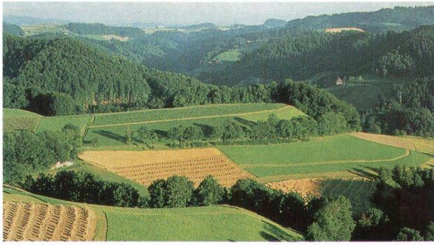
Mit Landschaftsentwicklungskonzepten werden verschiedene Nutzungsansprüche an die Landschaft besser aufeinander abgestimmt. (Archivbild ti)

Neben der Aus- und Weiterbildung von Raum- und landschaftsplanern erfüllt die HSR auch wichtige Aufgaben im Bereich Forschung und Entwicklung. Zwar hat sie sich schon bisher forschend betätigt, doch hat dieser Bereich mit der Fachhochschulreform erheblich an Bedeutung gewonnen. Deshalb hat die Schule im vergangenen Frühjahr eine Fachstelle für Landschaftsentwicklung eingerichtet. Diese betreut wissenschaftliche Projekte, mit denen sie von Bundesämtern, Kantonen, Gemeinden, Verbän-