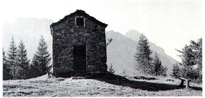
La modeste chapelle veille depuis 1761 sur un alpage dominant la vallée du Trient.

La construction de nouvelles routes d'évitement est une mesure d'aménagement qui induit diverses conséquences sur les sites contournés. Les questions d'accessibilité, de parcage et de vocation des voiries doivent dans un tel cas faire l'objet de réflexions d'ensemble. Par ailleurs, le coût écologique qui peut résulter d'emprises sur des espaces naturels doit être apprécié globalement et des compensations adéquates envisagées. L'étude des tracés et l'intégration «culturelle et paysagère» des ouvrages d'art ainsi que la nature des modifications apportées à une topographie existante sont indissociables de l'approche strictement technique. C'est pourquoi une évaluation prenant en compte les divers aspects et données considérés permet d'intégrer soigneusement le projet aux données d'un site vulnérable. Il n'en demeure pas moins que dans un tel processus, la dimension de la concertation entre les diverses parties intéressées à de tels projets demeure généralement la clef de la réussite.