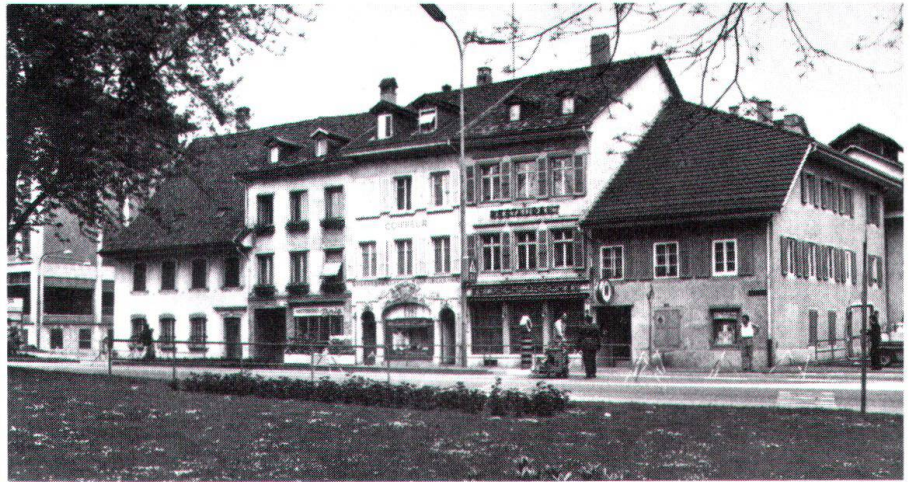
Hier, unmittelbar gegenüber der Altstadt und neben dem historischen «Zollhaus» und «Martin-Disteli-Haus», soll eine grossdimensionierte Überbauung entstehen.

Die zuständige politische Behörde behandelte diese Frage, entgegen der Stellungnahme der kantonalen Altetümerkommision , in ablehnendem Sinne. Die wichtigsten Argumente für eine Neuüberbauung: eine zugesicherte Nutzung von 2,4 (!), die durch die ungünstige Lage zwischen Strasse und Eisenbahn fraglich gewordene Ausnützung in