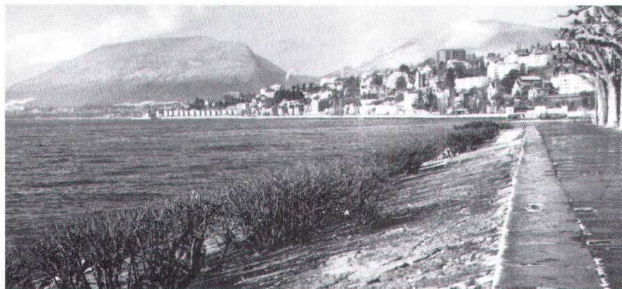
Bild unten: Die Quais von Neuenburg verbinden Stadt und See aufs schönste. Und hier entlang hätte die N5 führen sollen!

«Diese Politik der vollendeten Tatsachen gab uns schon in mehreren Fällen Grund zur Beunruhigung», hiess es dazu im erwähnten Communiqué. Hauteville sollte als Testfall dienen, um dem kulturellen Erbe des Kantons Fribourg weitere unersetzliche Verluste zu ersparen. Denn hier sind im Moment gefährdet: Bauernhäuser in Farvagny; die alte Pfarrei von Estavannens aus dem 17. und 18. Jahrhundert (wegen der Erweiterung eines Parkings!); die alte Kirche von Montbrelloz (13. Jahrhundert) bei Estavayer und die gedeckte Holzbrücke von 1831 über die Sionge bei Vuippens. Letztere wurde als zu schmal für den heutigen Verkehr bezeichnet. – In solchen Fällen bieten sich jedoch statt einer Zerstörung noch andere Lösungen an!