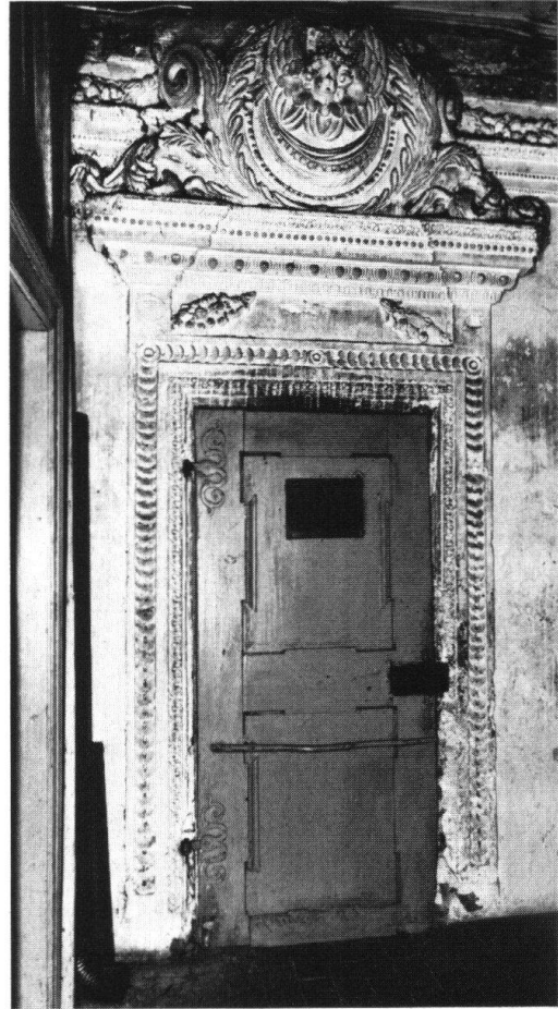
Rüttenen, ehemaliges Landhaus Glutz. Stucktüre der Brüder Schmutzer aus Wessobrunn (um 1678)

Nach dem Vorschlag des kantonalen Komitees sollte das Schützenhaus auf eine zweckmässige Weise wieder in das Leben der städtischen Gemeinschaft eingegliedert werden. Standort, Bauform, Raumeinteilung des Gebäudes legen die neuerliche Verwendung als Gastbetrieb und Gesellschaftshaus nahe. Das Bedürfnis ist allgemein anerkannt. Der markante Baukubus kann ohne grosse Veränderung restauriert werden, ebenso der angebaute Schützenstand, während die hässlichen Holzbaracken beseitigt werden müssten.