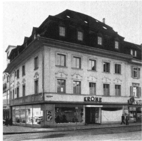
Olten. Hotel zur Krone. Zustand um 1840 (links) und heute (Vorschlag der Wiederbelebung einer historischen Herberge und Gastwirtschaft)

kaufte es seinerzeit auf Abbruch, um den – rein lokalen – Verkehr flüssiger gestalten zu können. Damit aber würde einem organisch gewachsenen Dorfbild das Rückgrat gebrochen. Die zuständigen Verkehrsleute vertreten übrigens die Ansicht, Tempobeschränkung bzw. Stoppsignal würden durchaus genügen.