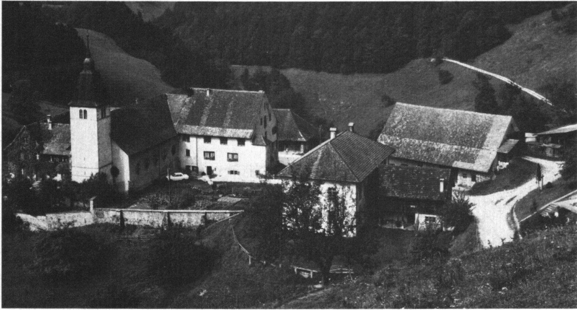
Beinwil SO. Ehemaliges Benediktinerkloster von Osten

Kirchen- und die Einwohnergemeinde Beinwil und der Staat Solothurn vertreten sein. Ziel ist es, hier wieder ein geistiges Zentrum zu schaffen, wie es vor 700 Jahren bestand, eine Renaissance von Beinwil im ökumenischen Geist.