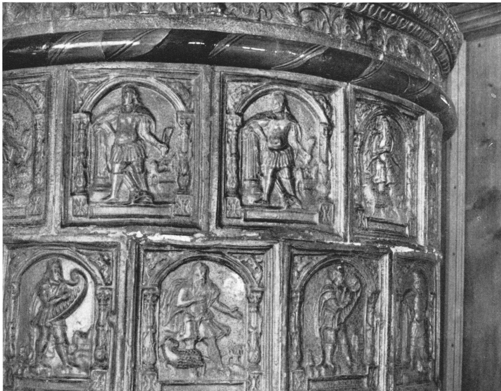
Le magnifique poêle de la grande salle, en catelles d'un vert sombre, raconte l'Histoire sainte. On y cherche vainement une date. Mais un autre tout pareil, sis dans la maison du Grutli, est daté de 1601.