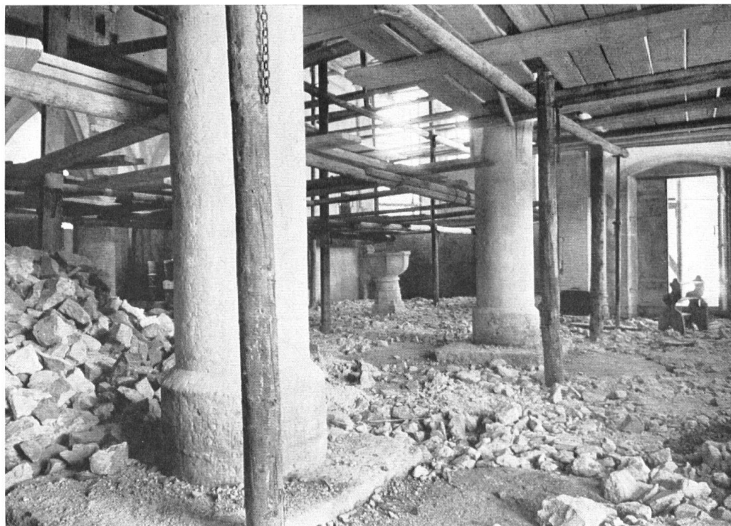
Les travaux de restauration, on le voit ici, n'ont pas été que de surface!