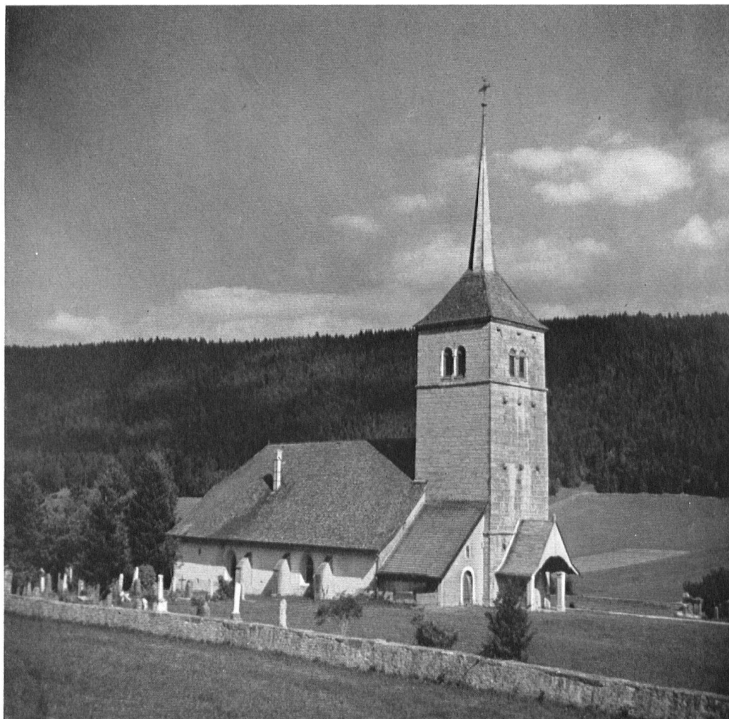
L'église de La Sagne avant sa restauration.