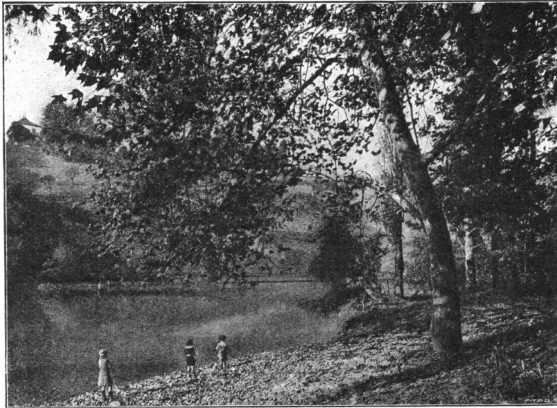
Fig. 13. Le Rhône au-dessous du bois de la Bâtie à proximité immédiate de la ville, offre des sites délicieux. Des mesures devraient être prises pendant qu'il en est encore temps pour sauvegarder les bords du Rhône. — Abb. 13. Die Rhône unterhalb des Bois de la Bâtie, in nächster Nähe der Stadt, bietet noch köstliche Landschaftsbilder. So lange es noch Zeit ist, sollten Massnahmen getroffen werden zum Schutz der Rhoneufer.

étrangères au fonds de commerce exploité dans la maison, et toutes celles qui font saillie sur les toits.