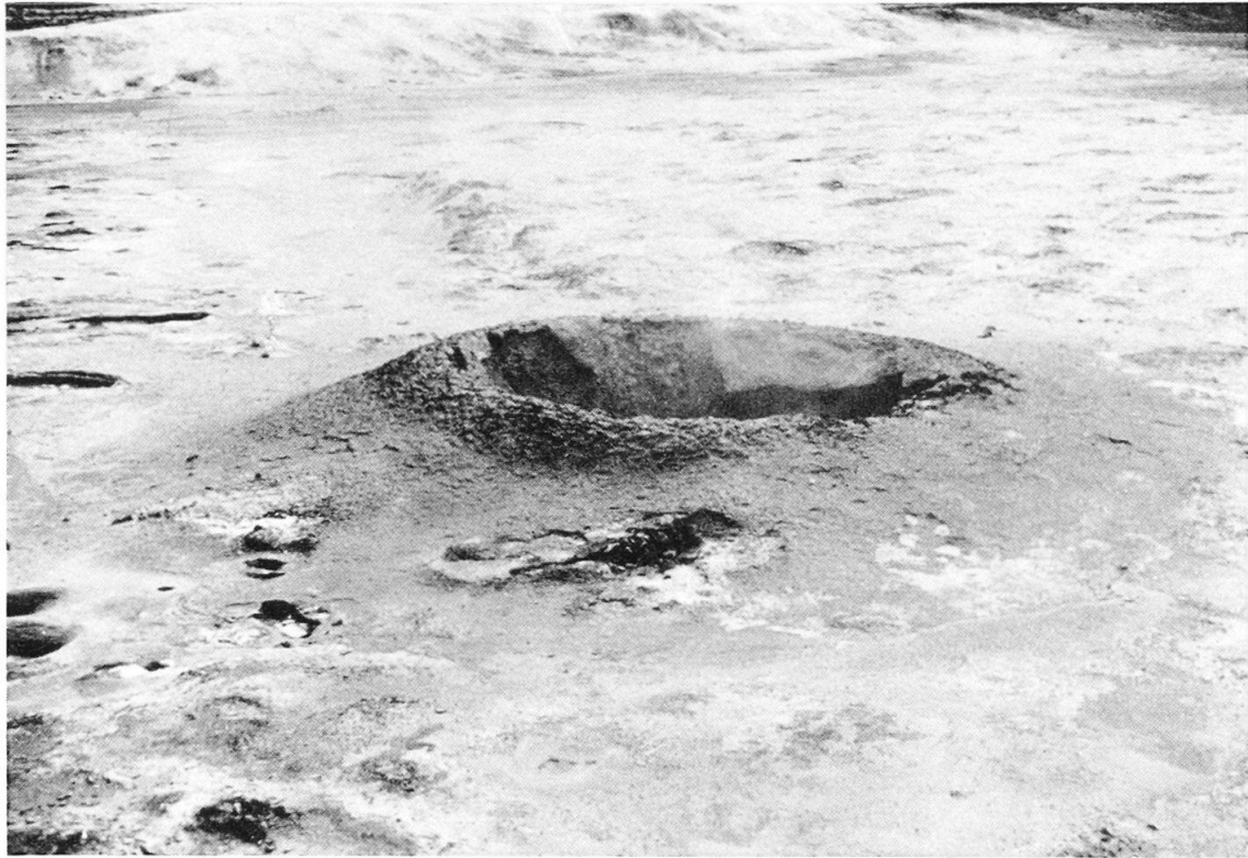
Abb. 2: Grauschwarzer Schlammvulkan; darum herum poröser weißlicher Boden.