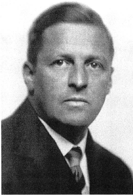
Abb.3.H.Böker (Thüringisches Hauptstaatsarchiv Weimar, Thüringische Volksbildung, C 2610, PA Böker).

und Berlin zwischen 1906 und 1911 bestand er 1911 das medizinische Staatsexamen in Freiburg. Ein Jahr später wurde er zum Dr. med. mit der Abhandlung Der Schädel von Salmo Salar promoviert und erhielt seine Approbation als Arzt am 14. Februar 1913. Zwischen 1912 und 1932 arbeitete er als Assistent und Prosektor am Anatomischen Institut in Freiburg im Breisgau, wo er sich auch 1917 mit der Arbeit Die Entwicklung der Trachea bei Lacerta agilis habilitierte. Den Ersten Weltkrieg erlebte Böker an der Westfront. Im Jahre 1917 wurde er Privatdozent in Freiburg, 1921 ausserordentlicher Professor und hatte vom 1. Oktober 1922 bis 31. März 1923 ein Extraordinariat für Anatomie in Jena inne. Im Jahre 1927 folgte seine Ernennung zum beamteten ausserordentlichen Professor in Freiburg,