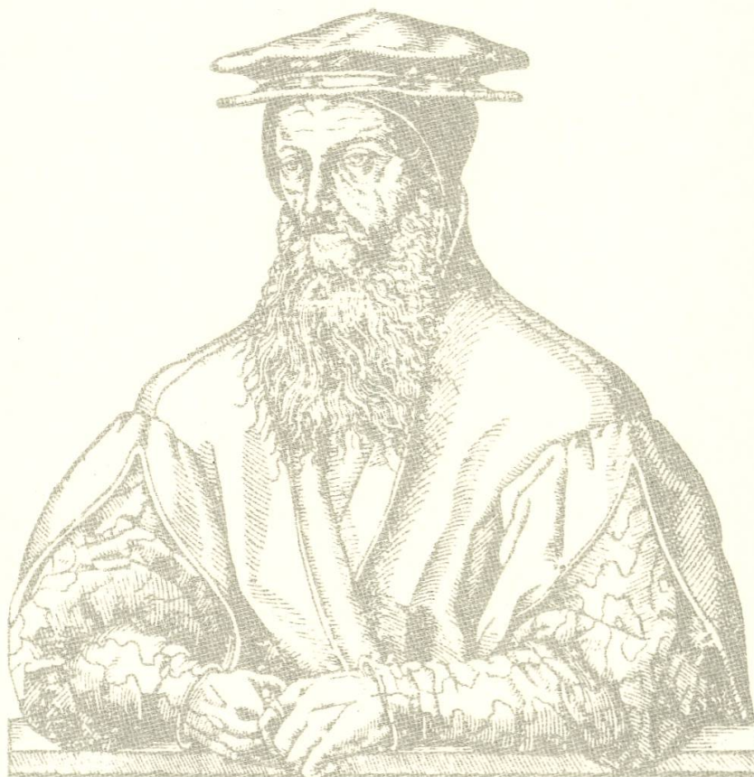
Conrad Gessner 1516–1565

Swiss Journal of the History of Medicine and Sciences Vol. 57 (2000) N° 3/4