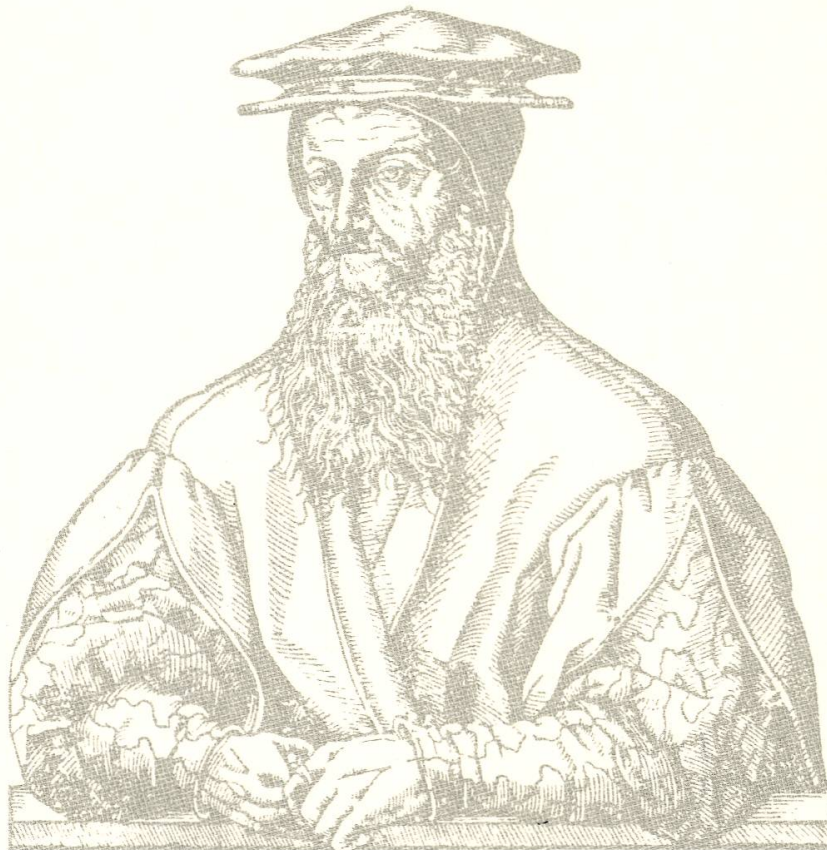
Conrad Gessner 1516–1565

Swiss Journal of the History of Medicine and Sciences Vol. 56 (1999) N° 3/4