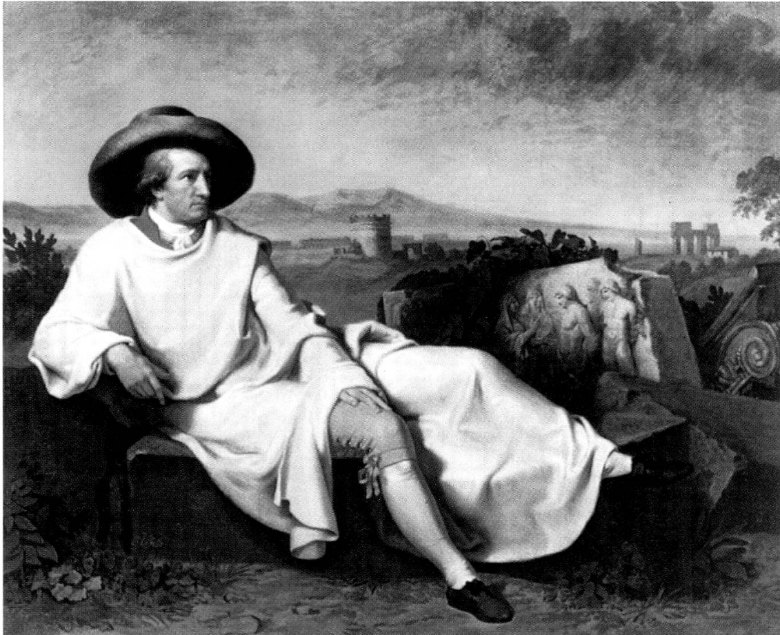
Abb. 1. J.H.W. Tischbein «Goethe in der Campagna di Roma», Städelsches Kunstinstitut Frankfurt am Main.

Diese lapidare Aussage gab den Anlass zu weiteren Nachforschungen über Aussehen, Entstehung und Verbleib dieser Zeichnung. Im Archiv der Familie Lavater in Zürich fanden sich noch weitere Briefe mit Vertretern des Weimarer Hofes, die über diese pharmazie- und kunsthistorisch interessante Begebenheit Aufschluss gaben 2 . Die Zeichnung, welche heute im Goethe-Nationalmuseum in Weimar verwahrt wird, ähnelt dem Ölgemälde «Goethe in der Campagna di Roma» von Johann Heinrich Wilhelm Tischbein (1751–1829) – dem Sinnbild für Goethes italienische Reise, das sich heute im Städelschen Kunstinstitut Frankfurt befindet (Abb. 1) 3 . Wie das Bild in den Besitz der Familie Lavater gelangte und welche Beziehungen zu Johann Wolfgang von Goethe (1749–1832), aber auch zu Tischbein bestanden, soll nachfolgend näher beleuchtet werden.