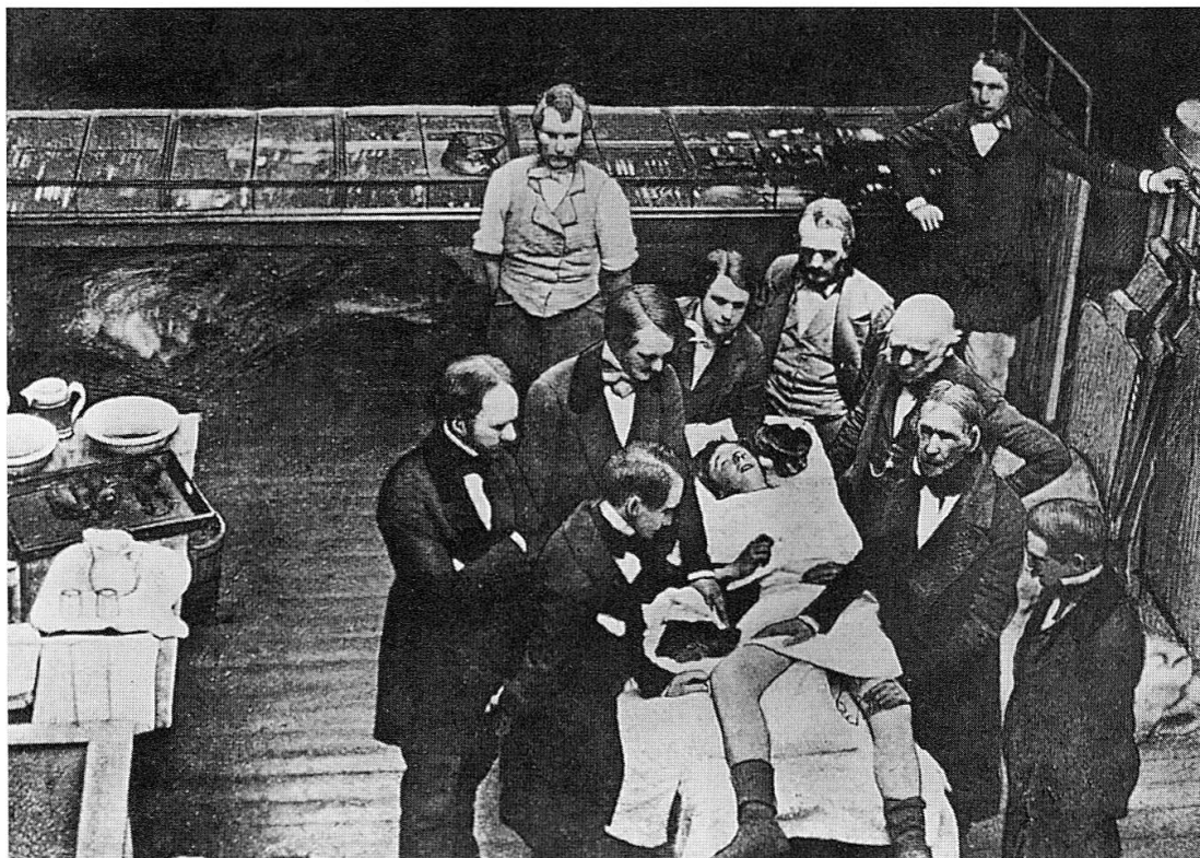
Fig. 1. Members of the team that performed the world's first operation under an anaesthetic on October 16, 1846, at the Massachusetts General Hospital in Boston: right in the foreground, with his hands on the legs of the patient, head surgeon John Collins Warren; at the operating table, wearing a checked waistcoat, dentist William Thomas Green Morton, Daguerreotype of October 17, 1846.