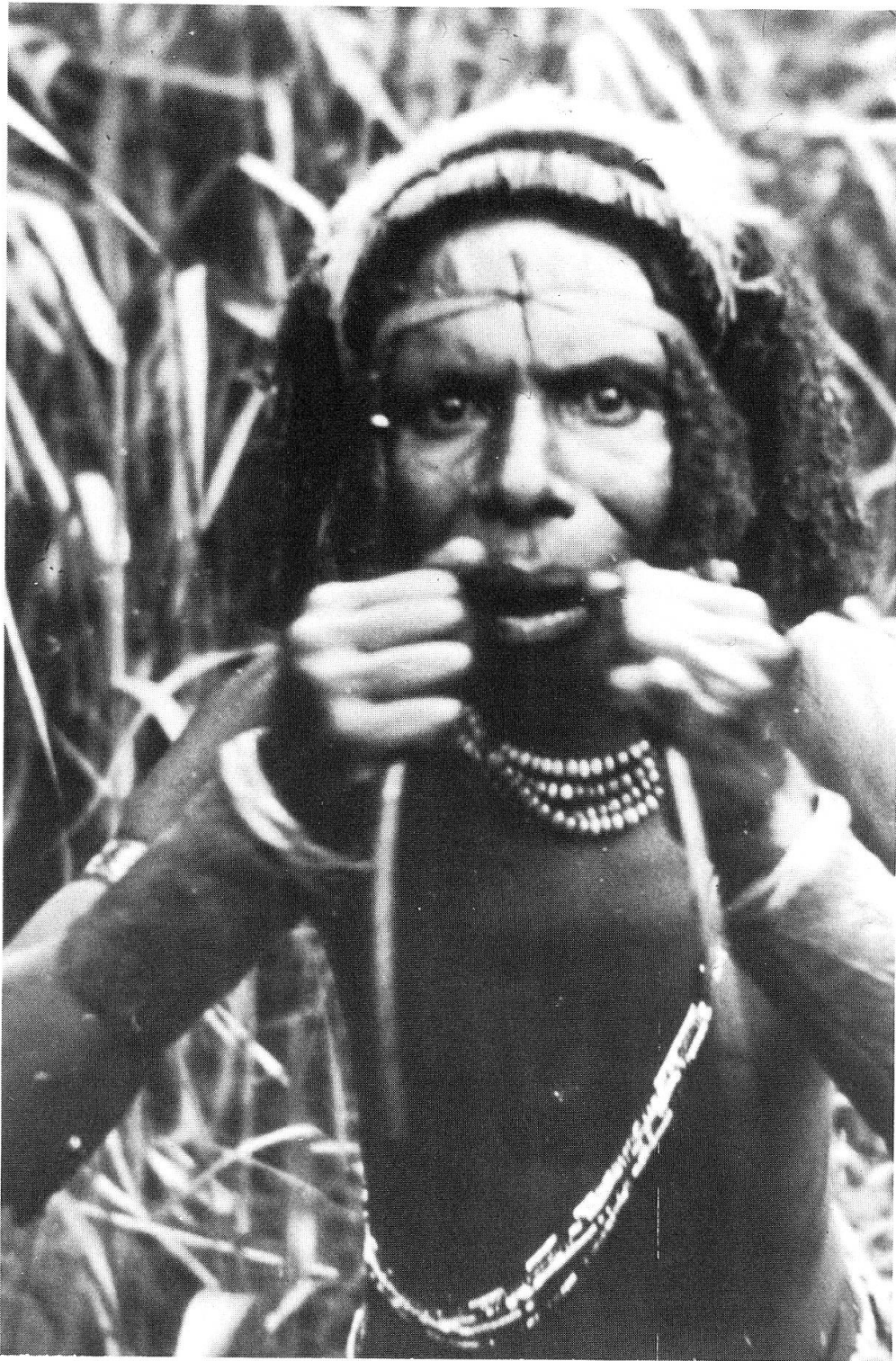
Abb.4. Nach Applikation der Magenrute wird durch rhythmische Bewegungen Brechreiz erzeugt (Bena-Bena).