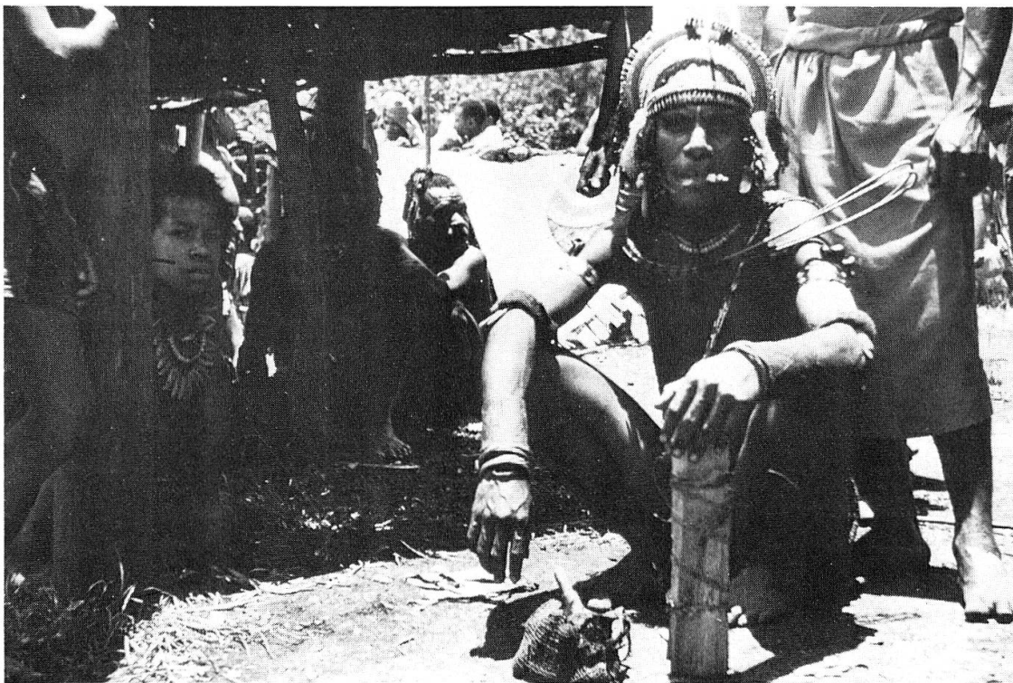
Abb. 2. Junger Bena-Mann mit zwei Magenruten, die als Halsschmuck getragen werden (1962)

Meine eigenen Beobachtungen über den Gebrauch der Magenrute beschränken sich auf die Bena-Bena (Abb. 2), eine Sprachgruppe im Markham Valley, die zu Beginn der 1930er Jahre erstmals mit Europäern in Kontakt gekommen ist. Nach Literaturangaben 24 war die Verwendung eines ähnlichen Utensils aber auch gewissen Nachbarvölkern der Bena-Bena bekannt (Gahuku-Gama-Gruppe).