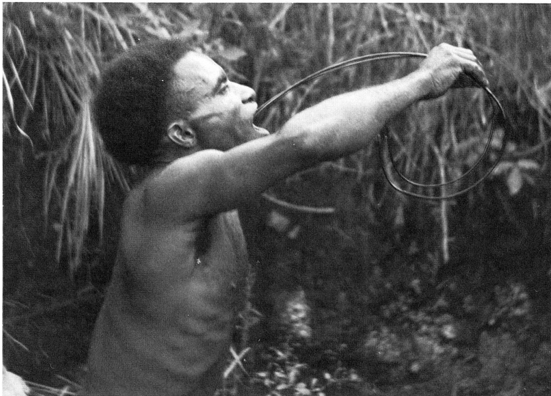
Abb. 3. Typische Körperhaltung beim Einführen der Magenrute (Bena-Bena)

In erster Linie wurde damit bei den Initiationsfeierlichkeiten eine rituelle Reinigung der Novizen bewirkt 25 . Daneben konnte man sich angeblich auf der Jagd nach Wildschweinen und Kasuaren den überfüllten Magen entlasten und so die Ausdauer beim Verfolgungslauf verbessern. Und schließlich war – nach den Informationen von Ronald Berndt – die Liste der Anwendungsmöglichkeiten noch durch folgende Ratschläge zu ergänzen: «Wenn eine Frau dir Nahrung gibt, nimm diese Rute, verschlucke sie und erbreche.