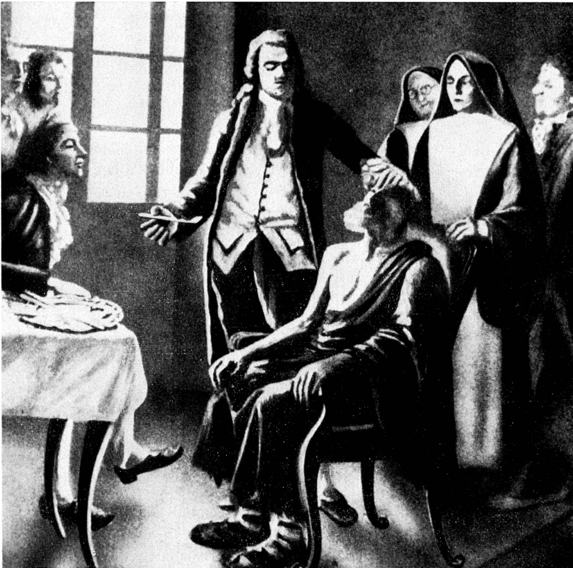
Fig. 1. Tableau de E.Mein (1925)