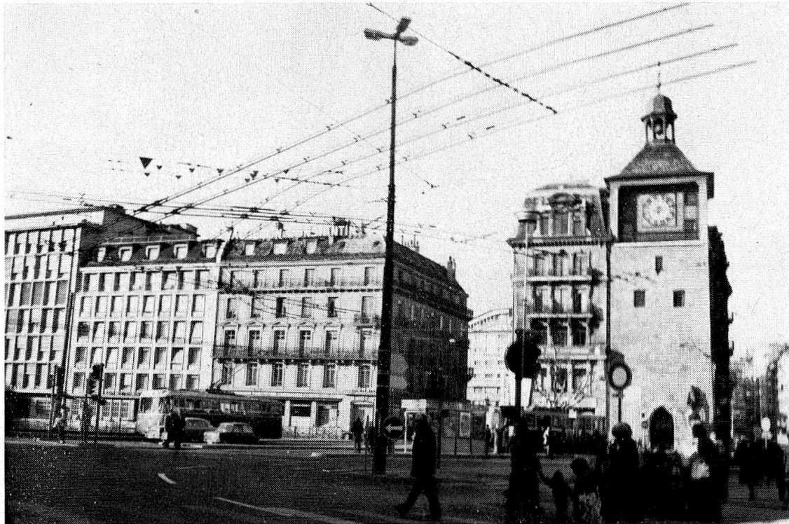
Fig. 3. Vues de la Place Bel-Air, a) par Geissler au XVIII e , b) en 1976