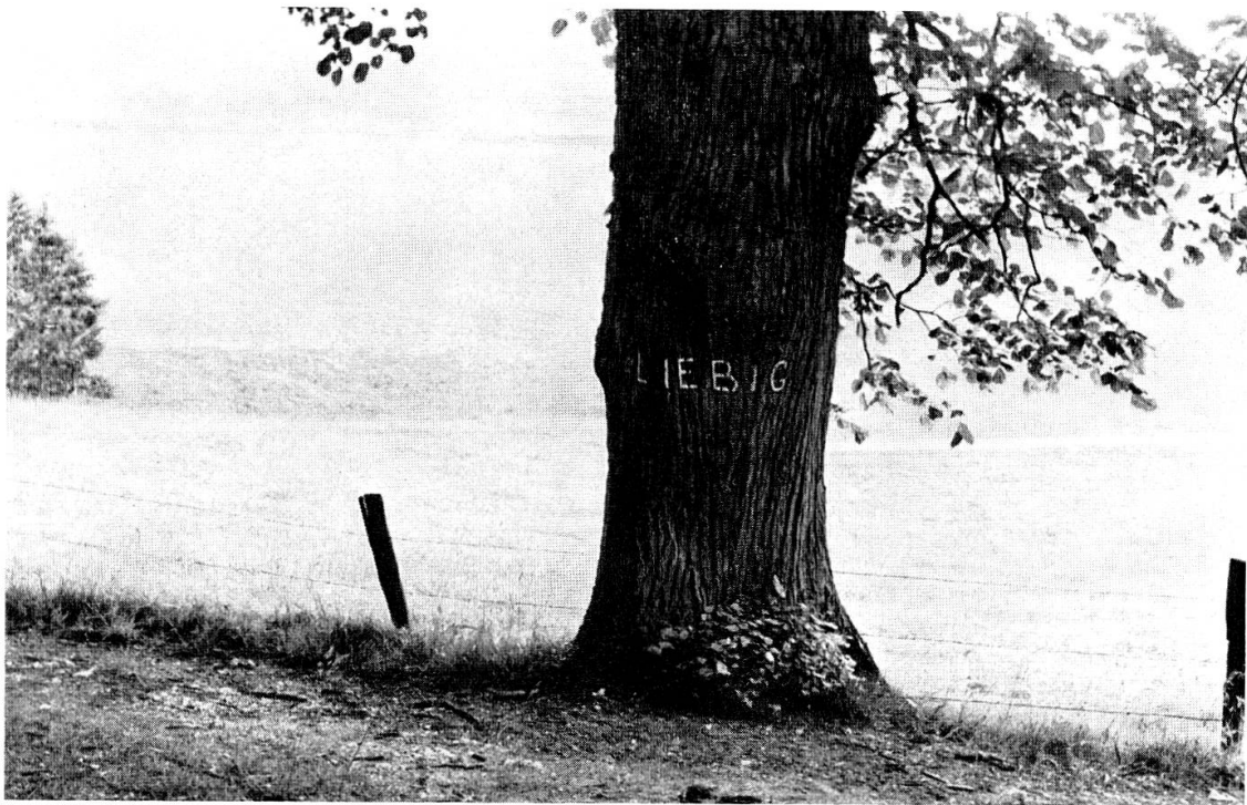
Der dem Chemiker Justus Liebig gewidmete Baum