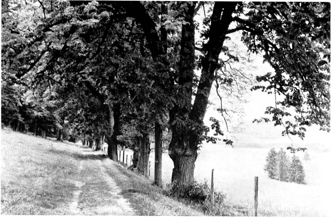
Die Allée des naturalistes , deren Bäume die Namen einstiger Gäste tragen. Im Vordergrund der knorrige Stamm mit dem Namen Gressly