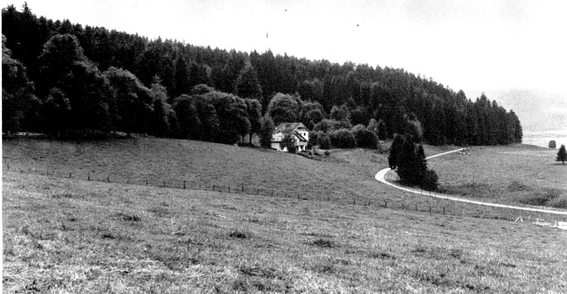
Auf der Berghöhe hinter Neuenburg, im Hochtal von Les Ponts, am Südrand des breiten Moores und am Saum eines aufsteigenden Waldes, hinter dessen Kamm die Felsen zur Areuse hinabstürzen, liegt einsam Desors Landhaus Combe-Varin, links davon die Naturforscherallee