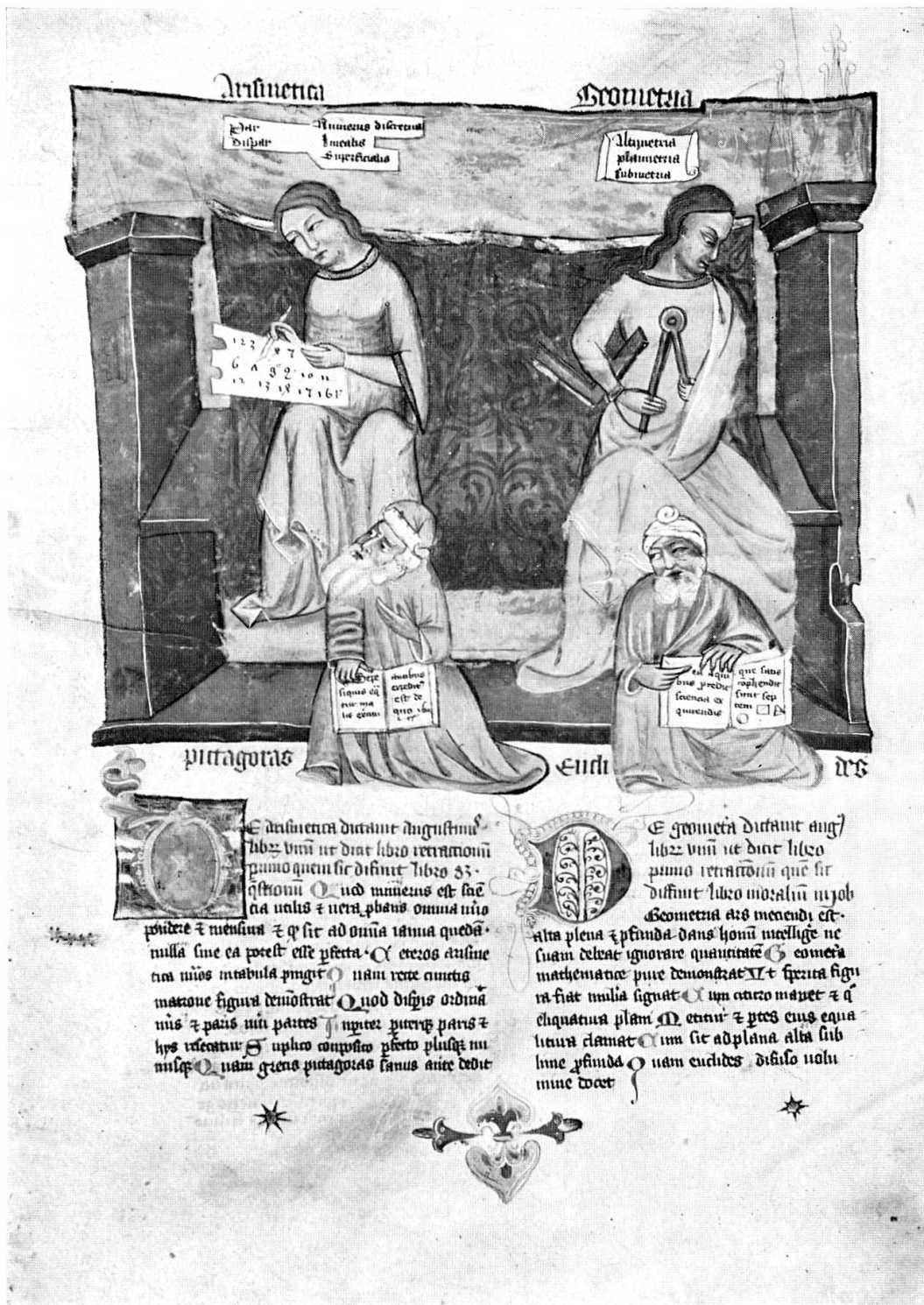
Abb. 5. Allegorische Darstellung der Arithmetik (links) und der Geometrie (rechts) (Österreichische Nationalbibliothek, Cod. S. n. 2639, fol. 35 v)