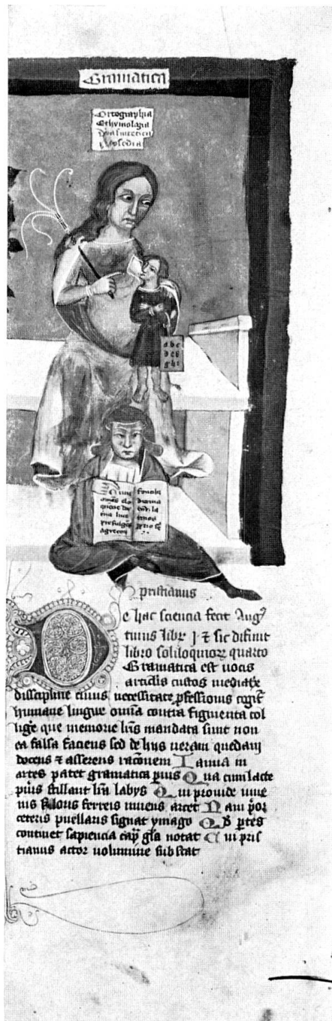
Abb. 3. Allegorische Darstellung der Grammatik (Österreichische Nationalbibliothek, Cod. S. n. 2639, fol. 34v)