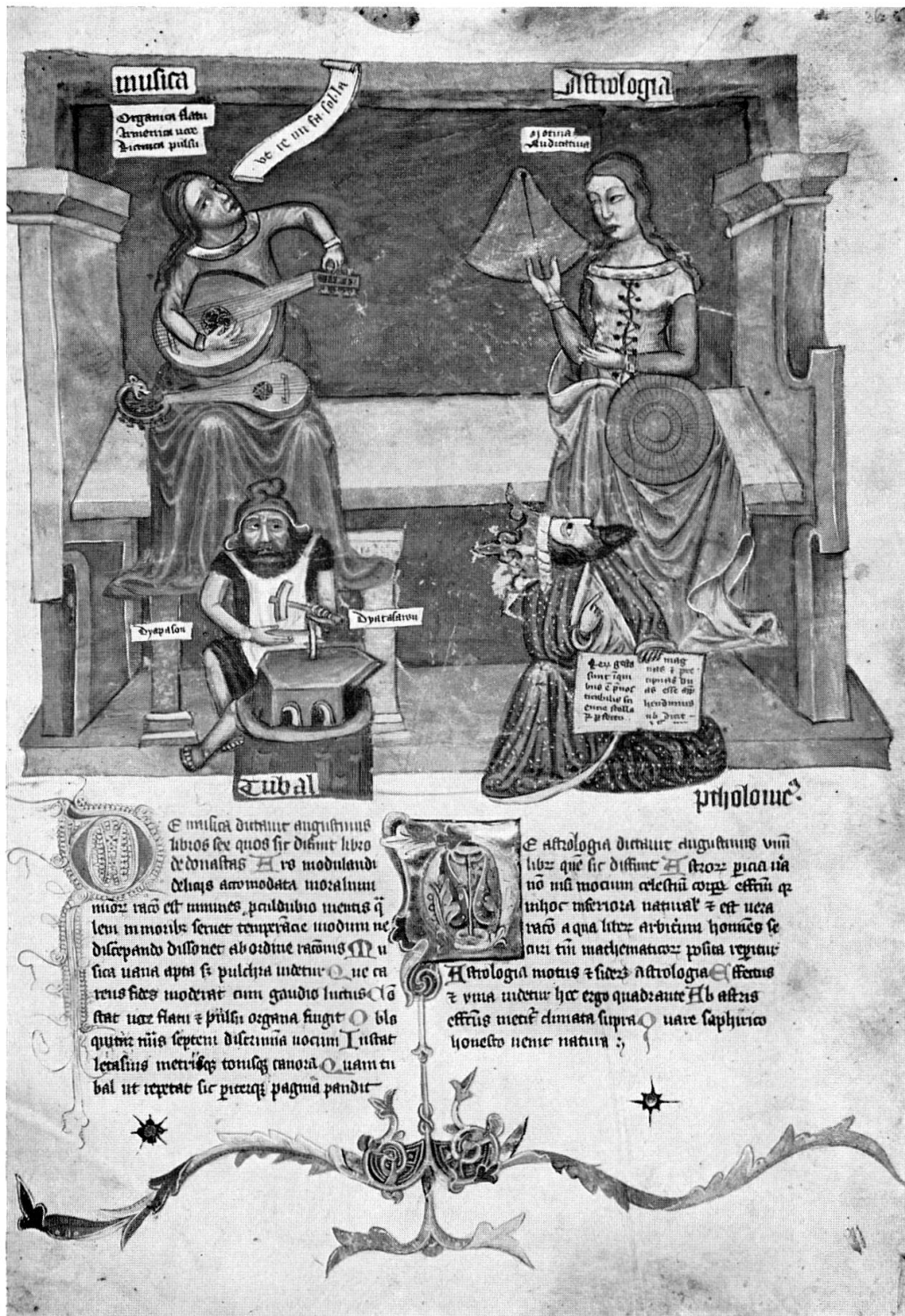
Abb. 6. Allegorische Darstellung der Musik (links) und der Astrologie (rechts) (Österreichische Nationalbibliothek, Cod. S. n. 2639, fol. 36 r)