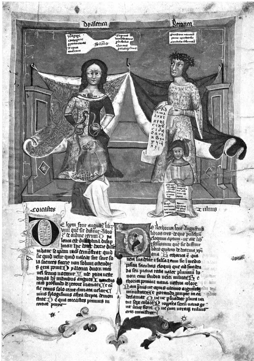
Abb. 4. Allegorische Darstellung der Dialektik (links) und der Rhetorik (rechts) (Österreichische Nationalbibliothek, Cod. S. n. 2639, fol. 35r)