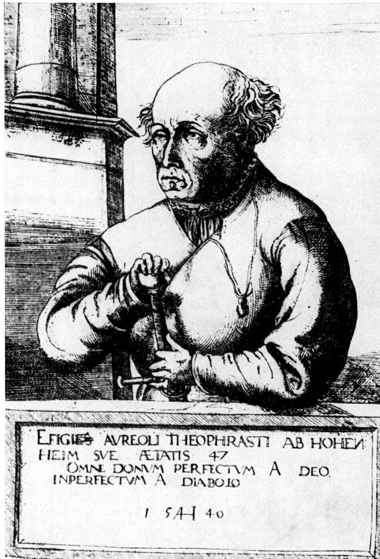
Abb. 2. Paracelsus

Kupferstich von 1540 nach der Darstellung des A. HIRSCHVOGEL