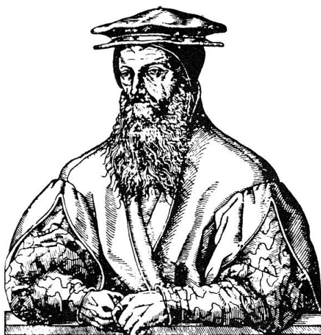
Konrad Gesner Arzt und Naturforscher in Zürich 1516–1565