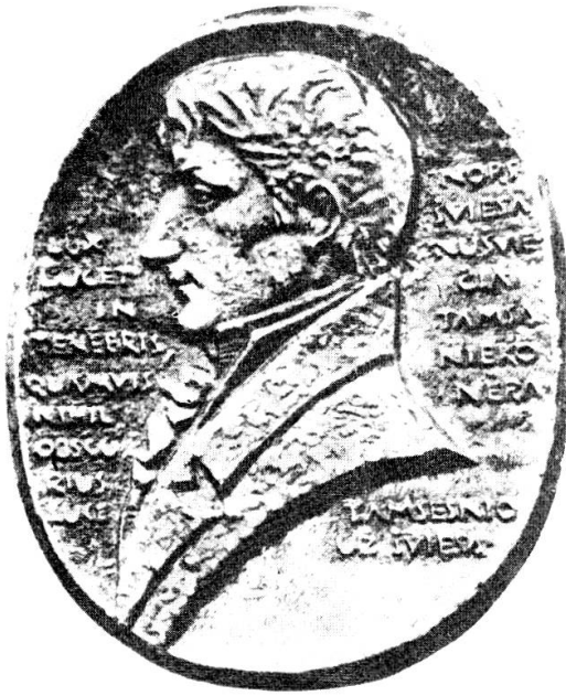
Abb. 1 Theodor von Grotthuss (Plakette am Denkmal)