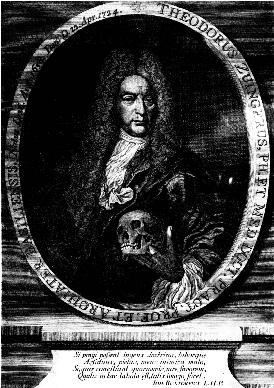
Abb. 2. Theodor Zwinger (der Jüngere), 1658–1724