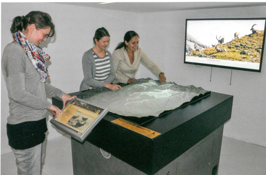
Abb. 3: Plexiglas-Relief im Center da Capricorns in Wengenstein im Naturpark Beverin.

Pärke von nationaler Bedeutung sind auch interessant für die Forschung in verschiedensten Disziplinen. Und auch in diesem Umfeld spielen raumzeitliche Aspekte und damit Karten eine grosse Rolle. In der UNESCO Biosphäre Entle-