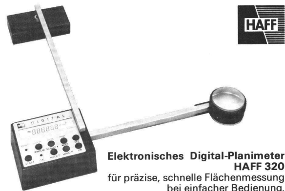
Elektronisches Digital-Planimeter HAFF 320 für präzise, schnelle Flächenmessung bei einfacher Bedienung.

Marktgasse 15 8640 Rapperswil Telefon 055/27 62 46