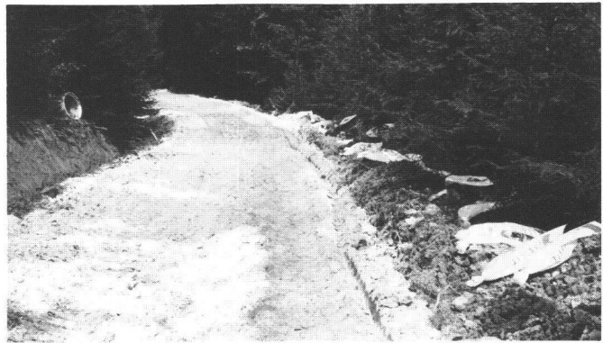
Abb. 2 Bei neuen Wegen im weichen Waldboden ist oft eine Stabilisierung mit Kalk oder Zement von Vorteil. Eingesandte Bodenproben werden vom Labor der Betonstrassen AG in Wildeggen untersucht. Die notwendige Bindemittelmenge pro Quadratmeter wird dort festgestellt. Auf der Baustelle wird das Bindemittel, in Chabrey Kalk (siehe leere Säcke am rechten Bildrand) von Hand ausgestreut und mit Scheibengegen in den Beton eingearbeitet. Anschliessend wird maschinell planiert und mit Walzen verdichtet. Das dem Gelände angepasste Planum ist gleichzeitig Transportpiste.