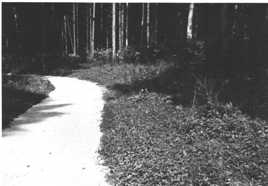
Abb.9 Älterer Forstweg mit Betonbelag in der Nähe von Chabrey. Von beiden Seiten wachsen die Waldpflanzen auf den Weg hinein. Der Betonbelag ist ein Wegbelag, der durch diesen Bewuchs keinen Schaden erleidet, ein besonders hinsichtlich Unterhaltsfreiheit nicht zu unterschätzender Vorteil dieser Belagsart.

z. B. auf alte Forstwege mit Kiesbelag, auf für den Transport mit geeigneten Dumpfern tragfähigen Waldböden usw.;