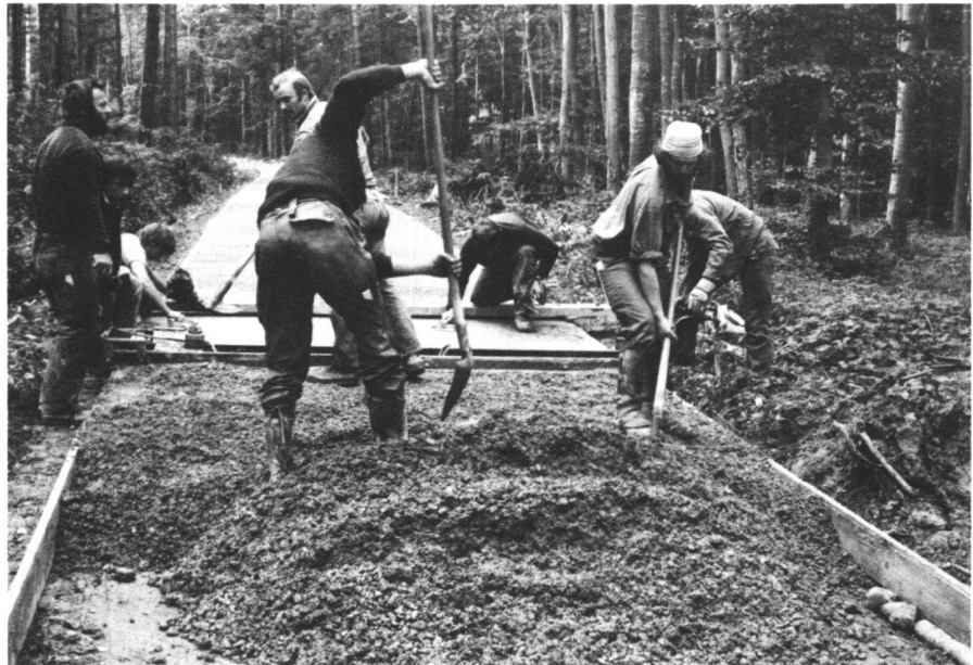
Abb. 5 Die Schüler der Interkantonalen Försterschule in Lyss bildeten beim Betonwegebau in Chabrey (Kanton Waadt) die Arbeitsequipen und stellten abwechslungsweise auch die Bauführung. Sie führten sämtliche Arbeiten, wie erstellen des Planums, stellen der Schalung, verteilen des Frischbetons, bedienen der Doppelrüttelbohle, verdichten und nacharbeiten des Betons, Einbau der Fugendübel und der Fugenstreifen wie auch das Aufräumen mit Besen und Nachbehandeln des Betons, selbst aus. Die Doppelrüttelbohle wird auf der Seitenschalung von zwei Mann langsam über den zu verdichtenden Frischbeton gezogen. Sie verdichtet den Beton in seiner ganzen Stärke von 18 Zentimeter.

Die Schalung (Bretterbreite 1 Zentimeter geringer als Betonstärke) wird auf das vorbereitete Planum gestellt und fixiert. Der Belag folgt dem Profil des Bodens. Das Quergefälle ist zu berücksichtigen, das Längsgefälle folgt den im Forstwegbau üblichen Vorschriften.