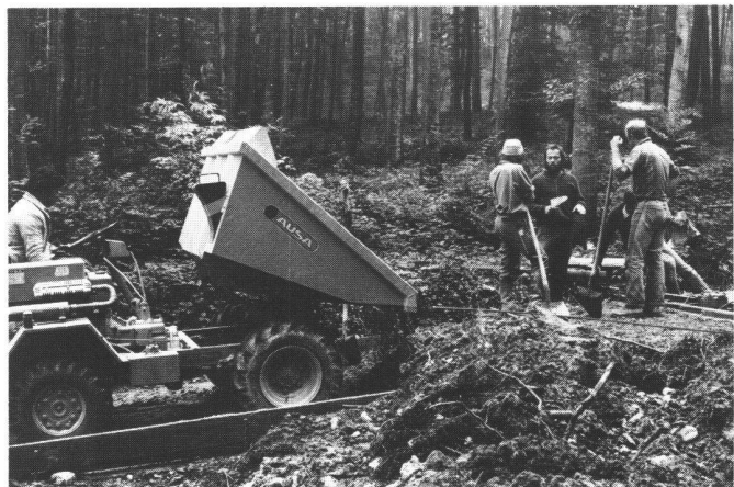
Abb. 4 Der Dumper kippt den Frischbeton vor Kopf, worauf er von Hand mit Schaufeln auf die notwendige Breite verteilt wird.