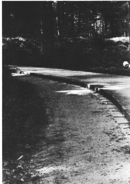
Abb.8 Von der Försterschule Lyss mit einem Fertiger auf einem alten wassergebundenen Schotterweg erstellter Betonweg (Maschineneinbau).

Der Fertiger ermöglicht eine grössere Leistung, was mehr Frischbeton pro Zeiteinheit verlangt, jedoch dadurch eine leistungsfähigere Transportorganisation bedingt. Mindestens zwei Dumper waren notwendig. Die Dumper