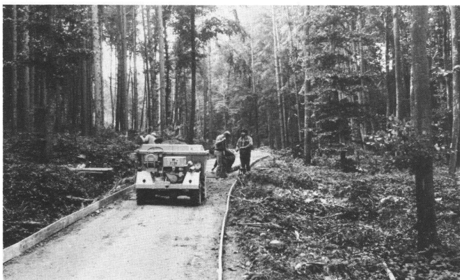
Abb. 3 Antransport des Frischbetons auf einem alten Forstweg mit einem Dumper beim Handeinbau. Die seitlichen Schalungen bestehen aus senkrecht gestellten Brettern, deren Breite = Betonstärke minus 1 Zentimeter ist. Auf ihnen gleitet die Doppelrüttelbohle.