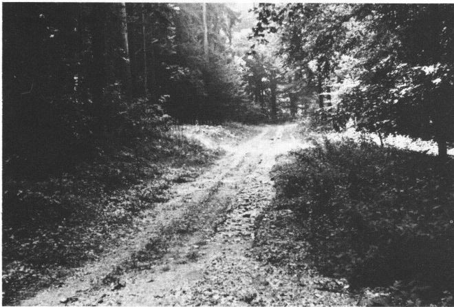
Abb. 1 Auf solchen alten geschotterten Forstwegen (sogenannte Kieswege) wird mit Hilfe eines Dozers ein dem Gelände angepasstes Planum erbaut, auf das Betonbeläge in der notwendigen Breite von 3 Meter und der Stärke von 18 Zentimeter erstellt werden. Weitere Fundationsarbeiten sind nicht notwendig. Auch ist der Antransport des Frischbetons auf diesen alten Wegen ohne Behinderung möglich.

Die Waldböden in der Gegend von Chabrey sind wenig tragfähig. Sie können nicht mit Lastwagen befahren