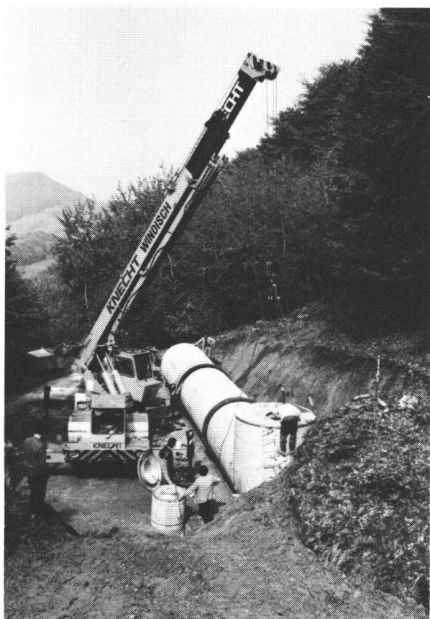
Montage des dreiteiligen Reservoirs

Das Reservoir dient der Erschliessung der neuen landwirtschaftlichen Siedlung «Asper-