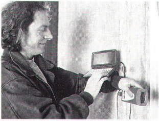
Abb. 2: DISTO memo in Verbindung mit Palmtop – die Einarm-Messlösung für perfekten Messkomfort.

besonders bequem, einfach und schnell durchgeführt. Die Messresultate müssen nicht mehr wie bisher von Hand notiert werden. Der Speicherplatz lässt sich praktisch in Gruppen unterteilen, d.h. entsprechend den unterschiedlichen Ansprüchen der verschiedenen Berufsgruppen wie Architekten, Ingenieure, Bauunternehmer, Zimmermann, Maler etc. organisieren. Mittels Recall-Funktion können die abgespeicherten Messwerte jederzeit aufgerufen und kontrolliert werden. Mit speziellen Tasten kann geblättert und zwischen Speicherplatz und Messwert hin- und hergesprungen werden. Die Messwerte können entweder zuerst im internen Speicher abgelegt und später über die eingebaute RS 232 Schnittstelle zum PC oder unmittelbar online übertragen werden.