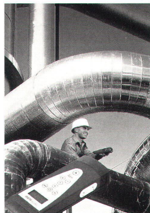
Abb. 1: DISTO memo Hand-Lasermeter. Das Messgerät für intelligentes, schnelles und punktgenaues Messen.

Der DISTO memo ermöglicht einfaches Abspeichern der Messwerte im Gerät. Bis zu 1000 Einzelwerte – Strecken, Flächen oder Volumen – können gespeichert werden. Aufmassarbeiten sind somit mit dem DISTO memo