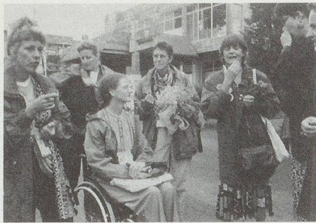
Das CH-NGO-Empfangskomitee wartet auf Bundesrätin Dreifuss.

die Konzentration auf Kultur- und Religionsunterschiede bietet wirtschaftlichen und anderen Interessengegensätzen ein Chance, sich dahinter zu verstecken.