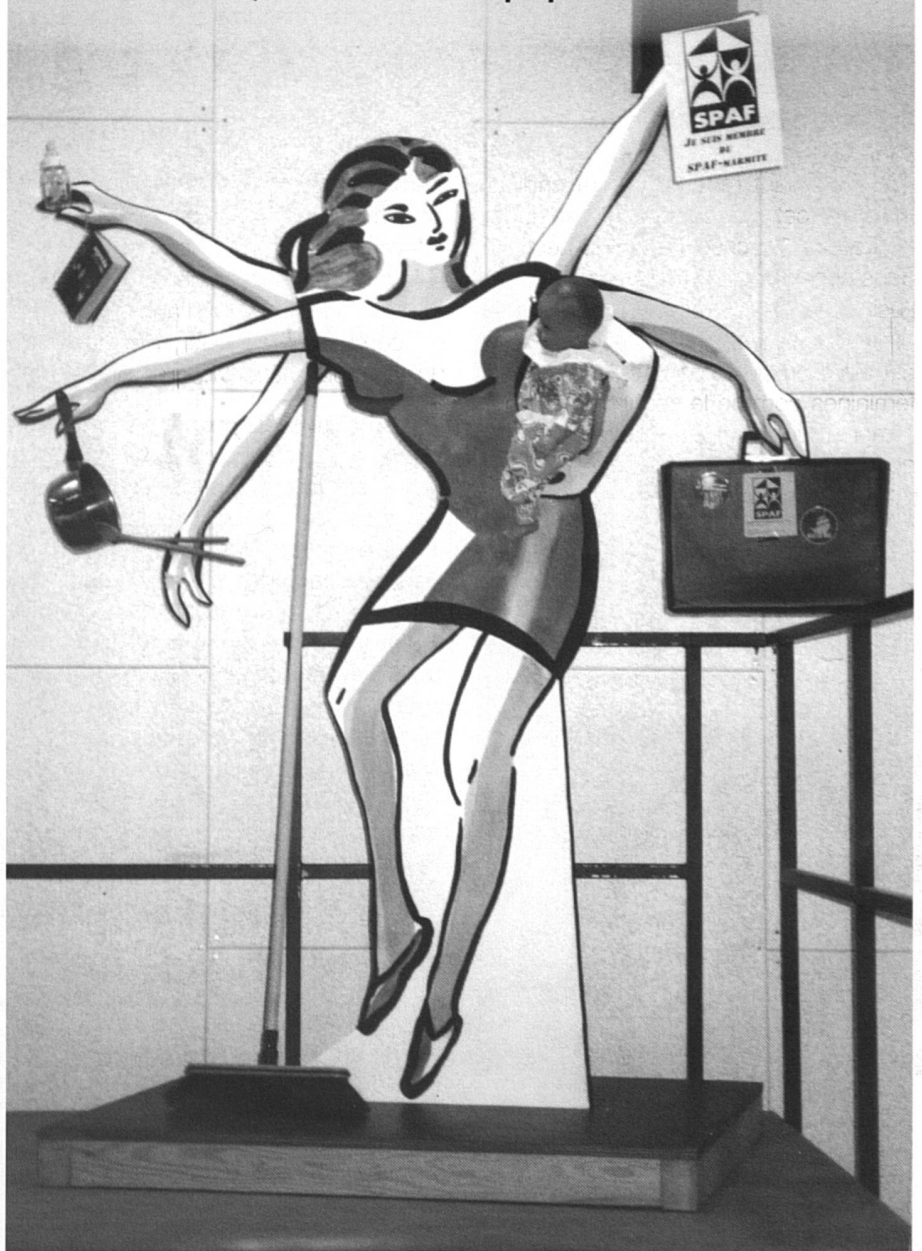
La mascotte du SPAF Syndicat des personnes actives au foyer à temps complet, ou partiel, créé en février 1992 à Genève pour défendre les intérêts des femmes au foyer, et valoriser leur travail non rémunéré, indispensable au bon fonctionnement de la société. Ses études sur l'évaluation monétaire du travail familial et domestique (voir dossier Femmes Suisses février 1994) l'ont fait connaître dans toute la Suisse romande ainsi que la revue "Ménage-toi".

Championne de l'enseignement ménager, la Société d'Utilité publique des femmes suisses ouvrit elle-même à ses frais, au siècle dernier, plusieurs écoles ménagères en Suisse alémanique et n'eut de cesse, au tournant du siècle, de réclamer un enseignement ménager obligatoire pour toutes les jeunes filles. Mais l'Etat renâclait à la dépense.