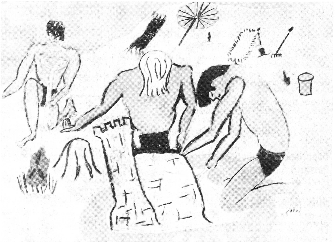
Châteaux de sable