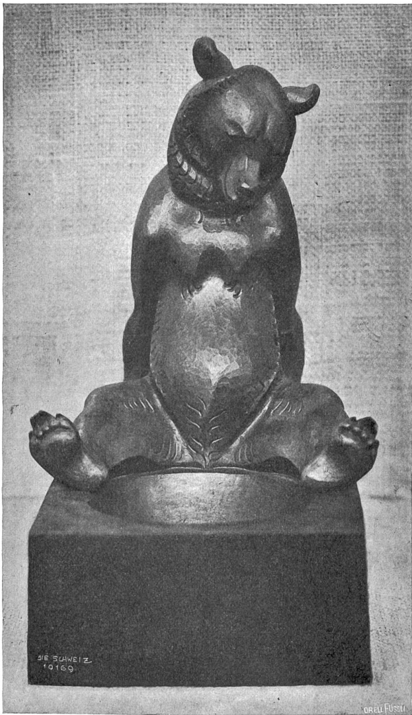
Schnitzler-Schule Brienz. Behälter mit Bär. In der Abteilung für Holzschnitzerei der Schweiz. Landesausstellung.

So um die Zeit der großen französischen Revolution fand in Sumiswald der Bau von metallenen Blasinstrumenten