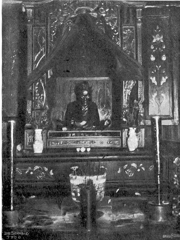
Der Buddha von Guatake (China).

italienische Gesandtschaft in Bern vor kurzem errichtet haben, und auf der letzten Seite endlich die einzig existierende Photographie des geheimnisvollen „lebenden Buddha“ von Guatake in China. Dieses Götzenbild im Tempel des abseits von jedem Verkehr gelegenen Dertchens Guatake ist kein Gebilde von Menschenhand, sondern der Leichnam eines fanatischen Buddhajüngers, der sich selbst dem Hungertode geweiht hat, sich in jenem Tempel einschloß und weder Speise noch Trank zu sich nahm, bis er buchstäblich verhungerte. Nach seinem Tode setzte man den Leichnam in eine Schranknische des Tempels, wo man ihn fortan als Gottheit anbetete. Der Körper soll sich ohne jede Einbalsamierung jahrhundertlang in seiner jetzigen Form erhalten haben; er dürfte indes von den Priestern heimlich präpariert worden sein. Jedenfalls wird der Ort von der fanatischen Menge streng bewacht und ist bisher nur von wenigen Europäern betreten worden. Die Aufnahme war nur mit größter Vorsicht und nach Bestechung eines Priesters bei Nacht mit Blitzlicht möglich.