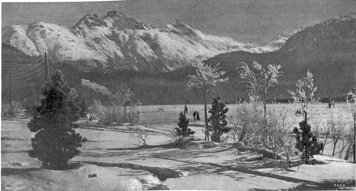
Winter im Engadin.