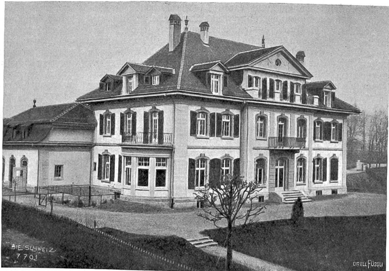
Das neue deutsche Gesandtschaftsgebäude in Bern.

Auf die glühende Lava hinabzublicken und das donnernde Zischen zu hören, das war etwas Einzigartiges und Neues, und ich wundere mich, daß abenteuerlustige Alpinisten nicht schon früher auf den Einfall gekommen sind, diesen Kraterabstieg zu wagen.“ Die Expedition währte im ganzen vier Stunden.