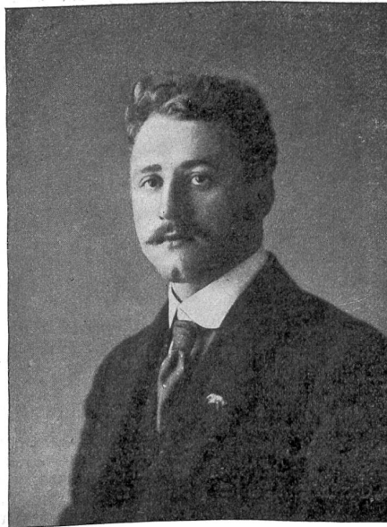
Oskar Bider, der populärste Schweizerische Fiattiker.

In der neuen Welt hat Präsident Wilson das Zepter ergriffen und durch einen Druck auf den elektrischen Knopf die letzte Scheidewand zwischen Atlantischem und Indischem Ozean im Panamakanal gesprengt. Wenn nur nicht