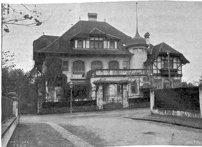
Das neue italienische Gesandtschaftsgebäude in Bern.

konstruierte ein mechanisches Geigenklavier, wie es hundert Jahre später in Nürnberg als neue Erfindung aufkam. Mit einem mechanischen Münzapparat wollte er die sichere Prägung von Geldstücken ermöglichen, mit einer Maschine 480,000 Nadeln täglich herstellen und damit jährlich 60,000 Dufaten gewinnen. Er benutzte als erster Linsen für ein Fernrohr zur Betrachtung des Mondes und hängte einen Kompaß in einem Ringgehäuse auf; er verstärkte mit einem Hörrohr das Vernehmen von Geräuschen, sprach von Schwimmgürteln und einer Taucherweste, benutzte das Wasser zur Verstärkung des Lichtstrahls, wie es bei Schusterlampen geschieht, und hatte damit vielleicht schon den Lampenzylinder entdeckt, der erst im achtzehnten Jahrhundert bekannt geworden ist. Vielerlei Versuche machte er mit Schraubengewinden, mit Zahnrädern, und er wollte sogar Schiffe mit Schaufelrädern vorwärtsbewegen; auch die Wasser- und Luftschraube hat er zuerst gefannt. Er benutzte den Pendel, machte Kreisstudien, erfand vor den Holländern die Windmühle mit drehbarem