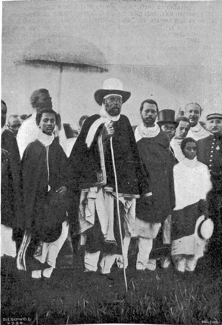
Kaiser Menelik mit Thronfolger Lidj Tassu.

hannes. Die Zukunft wird entscheiden, ob es dem Negus Lidj Tassu gelingt, seine Unabhängigkeit gleich seinem Vorgänger zu wahren. Später oder früher wird er um sie kämpfen müssen; denn Italien hat seine aethiopischen Pläne noch nicht aufgegeben.