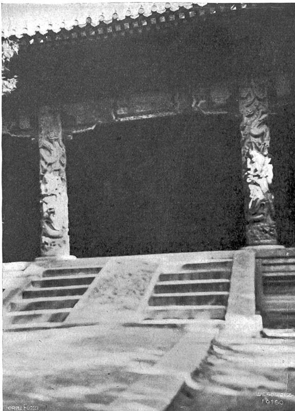
Chüfu Abb. 5. Tempel des Waters des Confucius.

Jegerlehners bester Art wenig anmerkt. Fast ist es, als ob der Dichter seine neue Schweizernovelle nach einem Rezept gearbeitet hätte, das einmal ein deutscher Kritiker dem schweizerischen Dichtervolk freundlichst zu liefern sich herbeileih. So etwas wie die Darstellung einer Totalität schweizerischer Daseinsformen scheint Jegerlehner in seiner personen- und situationsreichen Geschichte angestrebt zu haben; aber es ist doch mehr eine Summierung verschiedener Elemente geworden, die sich weder durchdringen noch eigentlich bedingen, und das Schweizerische bleibt trotz Hochgebirgspracht, Militärzauber, Alpenfrieden und Hotellerie doch mehr Dekoration, da die Geschichte selbst sich auf recht verbrauchten Romanmotiven aufbaut. An Einzelheiten, an reichen und packenden Naturdarstellungen und an einer Gestalt wie der verkrüppelte Schneider mit seiner merkwürdigen Geldfreude und Weltweisheit erkennt man wohl den Dichter und Gestalter Jegerlehner, wie wir ihn längst schätzen und lieben gelernt haben, und man freut sich auf sein nächstes Buch — so etwas wie eine Selbstbiographie ist uns verheißen — da er wieder aus echten Quellen schöpfen wird.