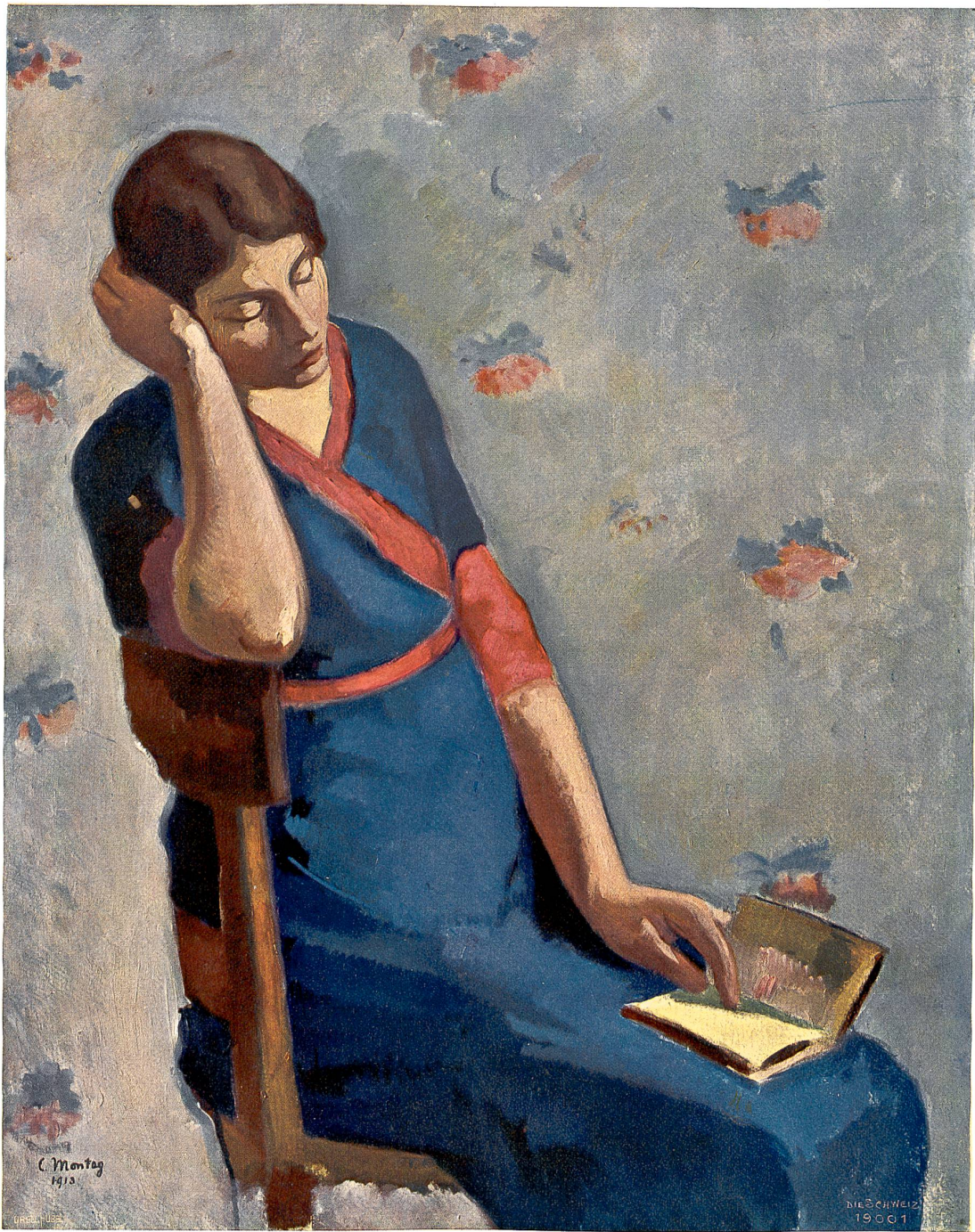
Aus dem „Salon“ der Schweiz, Landesausstellung 1914.