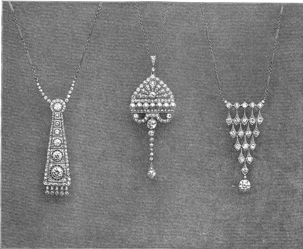
Drei Colliers (in Platin) der Firma G. Kofmehl-Steiger, Zürich (a) mit 86 Brillanten; b) mit 91 Brillanten, 4 weißen und 3 schwarzen Perlen; c) mit 24 Brillanten) an der Schweiz. Landesausstellung.

Teils in die Erzeugnisse der st. gallischen Industrie verteilt, teils in den beiden offenen Nischen tritt uns die Kunststickerei des Ateliers des st. gallischen Gewerbemuseums entgegen: Arbeiten in farbiger Seide und in Weißstickerei, die sich in Zeichnung und technischer Ausführung kühn an die Seite der viel bewunderten japanischen Arbeiten stellen dürfen.