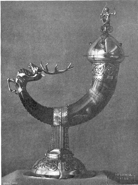
Tafelaufsatz «Jagd» aus dem Atelier G. Melster, Zürich (Mitarbeiter Arnold Stockmann, Luzern) an der Schweiz. Landesausstellung.

führen haben. Er vergleicht mit andern Industriezweigen. Das Fremdgewerbe sei unsere Lebensader? Das Eisenbahngetriebe unser Blutkreislauf? Stopp, Stopp — unsere Chronometer vermögen alles noch auszurechnen, ohne aufgezo-gen werden zu müssen.