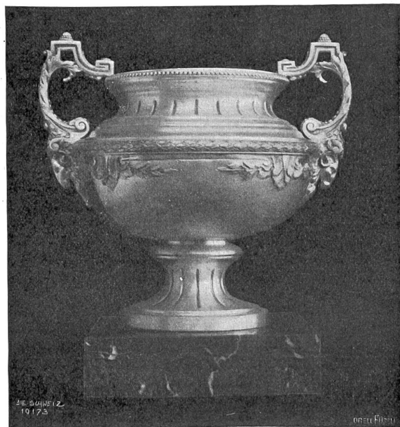
Sandzilierte Silbervase Louis XVI aus der Silberwarenfabrik Otto & Albin Wissemann, Zürich, an der Schweiz. Landesausstellung.

Nach Schweizer Chronometern werden die Sportstiege auf dem ganzen Erdball gemessen. Instrumente, bei denen schon die Handwärme zur Ausdehnung des Eisens genügt, er-möglichten die schier fabelhaften Präzisionschronometer, mit deren Hilfe die Zielrichter die Zeit des rasenden Bobleighs auf Fünftelsekunden austifteln.