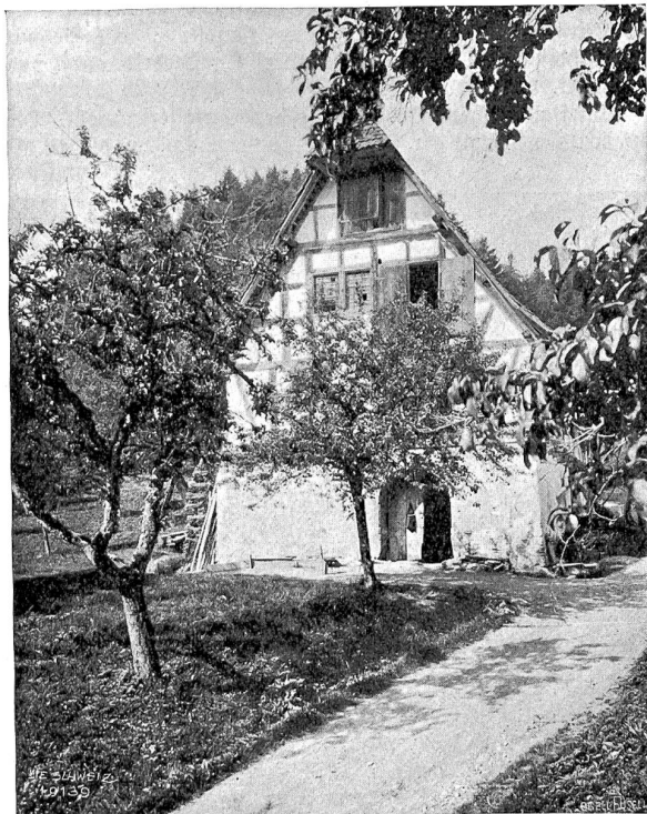
Altishofen Abb. 8. Bauernhaus beim Schloßli von 1671.

Mit einer feinen Wollust, einer mit jeder gewiegten Blütenbolde zugleich schwingenden Sensibilität fühlt Isabelle Kaiser