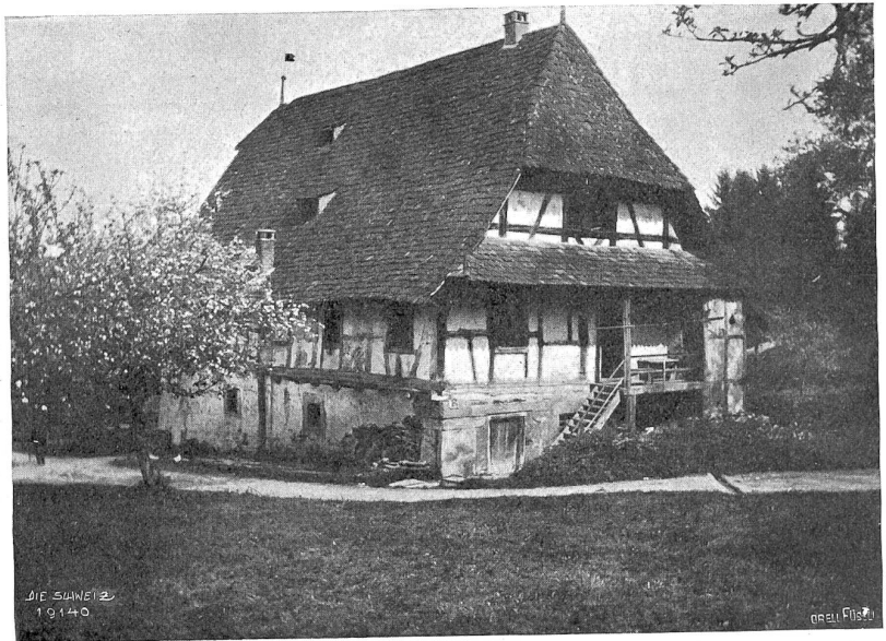
Altishofen Abb. 9. Bauernhaus beim Schloßli von 1671.

den Duft, den Wind, das Wellenrauschen ihrer Heimat. Wir haben bei dieser Erzählerin die der echt dichterischen Treue entstammende Anklammerung an die Heimat: „Ich atmete (am Morgen nach einer Fiebernacht) gierig den Erdgeruch des Klees, der aus der Scholle wuchs, wo meine Toten schliefen.“ Alpaufzüge mit einer liebevollen und anschaulichen Charakterisierung des Tierlebens machen der Urschweizerin Ehre. Eine gewisse Feinheit verrät ihre romanische Schulung. „Der ganze Monat Mai stieg mit ihnen zur Alp empor. Er schimmerte im Fell der Tiere, im Glanz ihrer braunen Haut, er sang in den klingenden Glocken, lobpries mit dem Jauchzer der Männer und duftete mit den blauen Trauben der Ackerhyacinthen, die schon nach reifen Pflaumen rochen. Die ganze Alp duftete nach zertretener Minze und nach wildem Fenchel. Die Jugend der Wildrosenstaude lachte aus den Felsenspalten.“