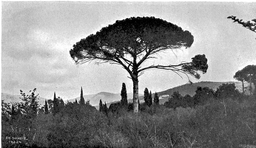
Bäume des Südens. Alte Pinie und Zypressen in der Villa Adriana zwischen Tivoli und Rom.