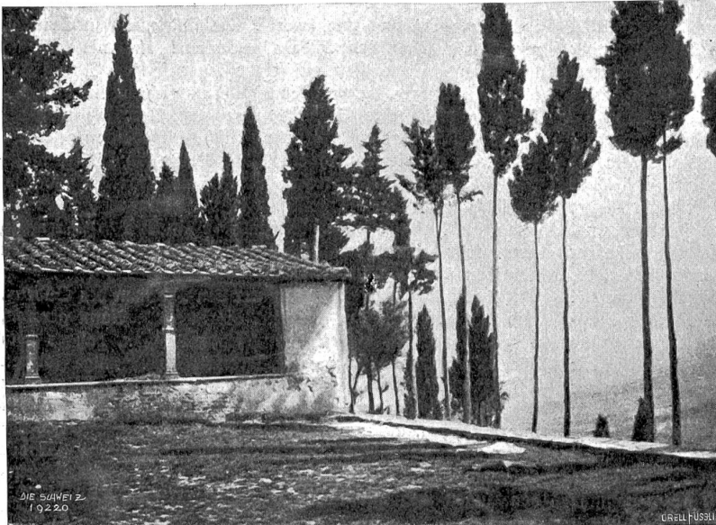
Bäume des Südens.

„He, Jacques,“ grüßt eine Frau, die sich eben am Mittelisch niedergelassen, den ihr Gegenübersitzenden. „Das ist einer, Ihr Jean-Pierre! Was haben wir gelacht!“ Und beim bloßen Gedanken lacht sie wieder, daß ihr die Tränen herunterlaufen. „Nur so aus dem Ärmel geschüttelt hat er die Berse über die neue Herrschaft im Schloß, über die Direktion der Fabrik, über die Geschichte von dem