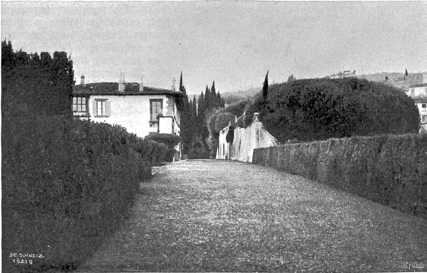
Bäume des Südens. Aus einem florentinischen Garten.

Blämen drüben — ihr wißt schon! Nein, was haben wir gelacht!“ Und wieder zieht sie ihr buntes Taschentuch, um die Tränen zu trocknen.