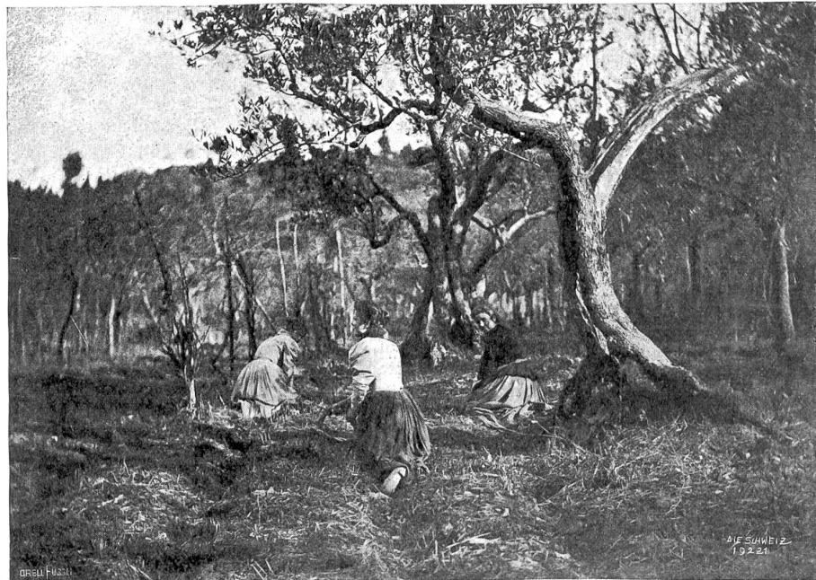
Bäume des Südens. Toskanische Oliven.

Ein Tuscheln und Flüstern: „God verdams, was soll denn das? Nichts zu machen heute! God verdams!“ Und ge-