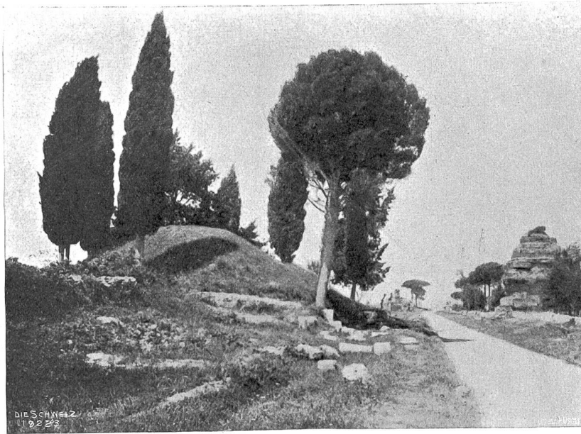
Bäume des Südens. Zypressen und Pinien an der Via Appia vor Rom.

„Aberglaube ist bald gesagt. Ich kenne aber keinen, der nicht, wenn's an ihn kommt, zum curé blanc läuft, um die bösen Geister bannen zu lassen.“