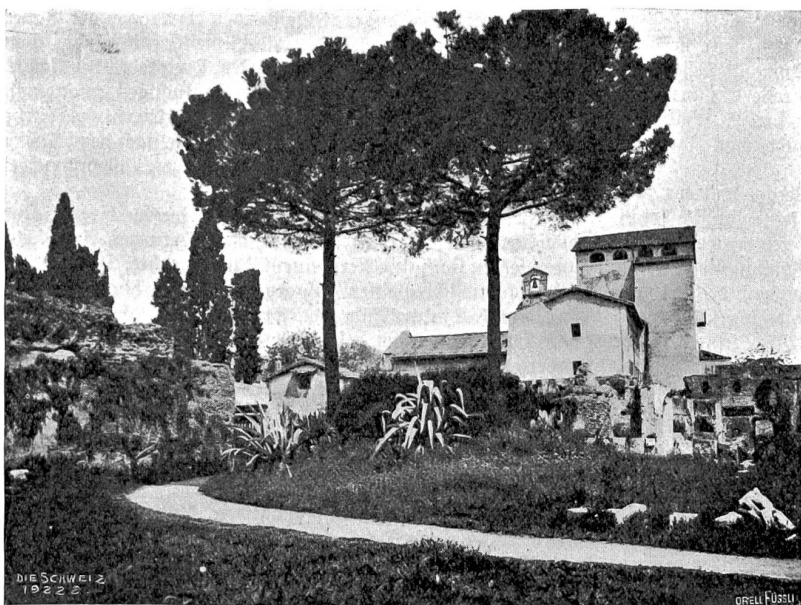
Bäume des Südens. Zypressen und junge Pinien auf dem Palatin (beim Kloster S. Bonaventura).

„Dummer Aberglaube!“ fuhr sein Sohn noch einmal dazwischen.