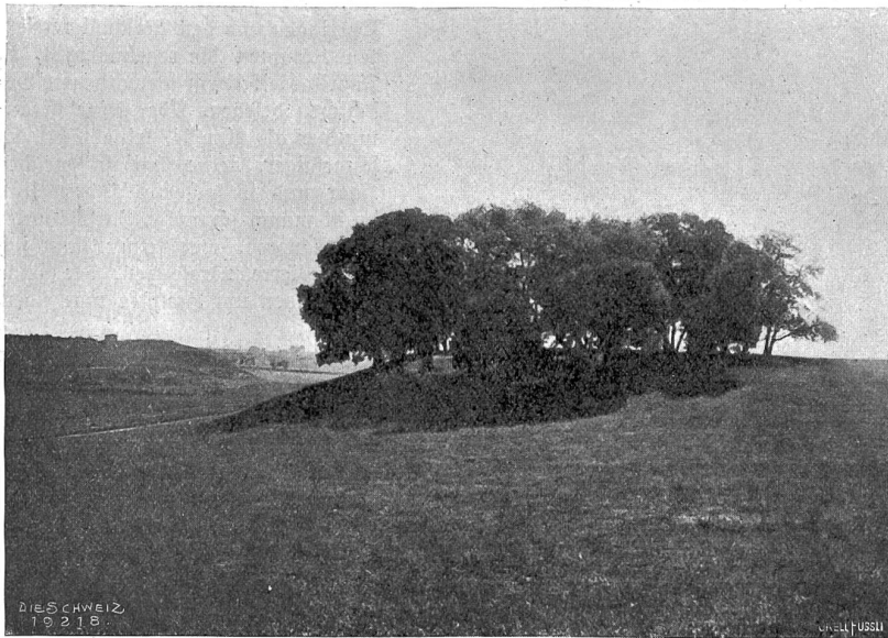
Bäume des Südens. Steinlehen des „Heiligen Hains“ (Bosco sacro) bei S. Urbano alla Caffarella in der römischen Campagna.

mächlich, schwerfällig verlassen die großen Gestalten den Raum. Manch kräftiger wallonischer Fluch folgt den Abziehenden. Aber er gilt nicht ihnen, er gilt der Poltzei, die sonst bei solchen Gelegenheiten beide Augen zuzudrücken pflegt und sich heute so unerwartet einmischet. Auch die Mädchen und Frauen haben für die Vertreter der Ordnung keine freundlichen Blicke. Man ist nicht hartherzig; aber eine Rauferei ist ein aufregendes Schauspiel, und wenn es zum Blutvergießen kommt, ist immer noch Zeit, davonzulaufen.