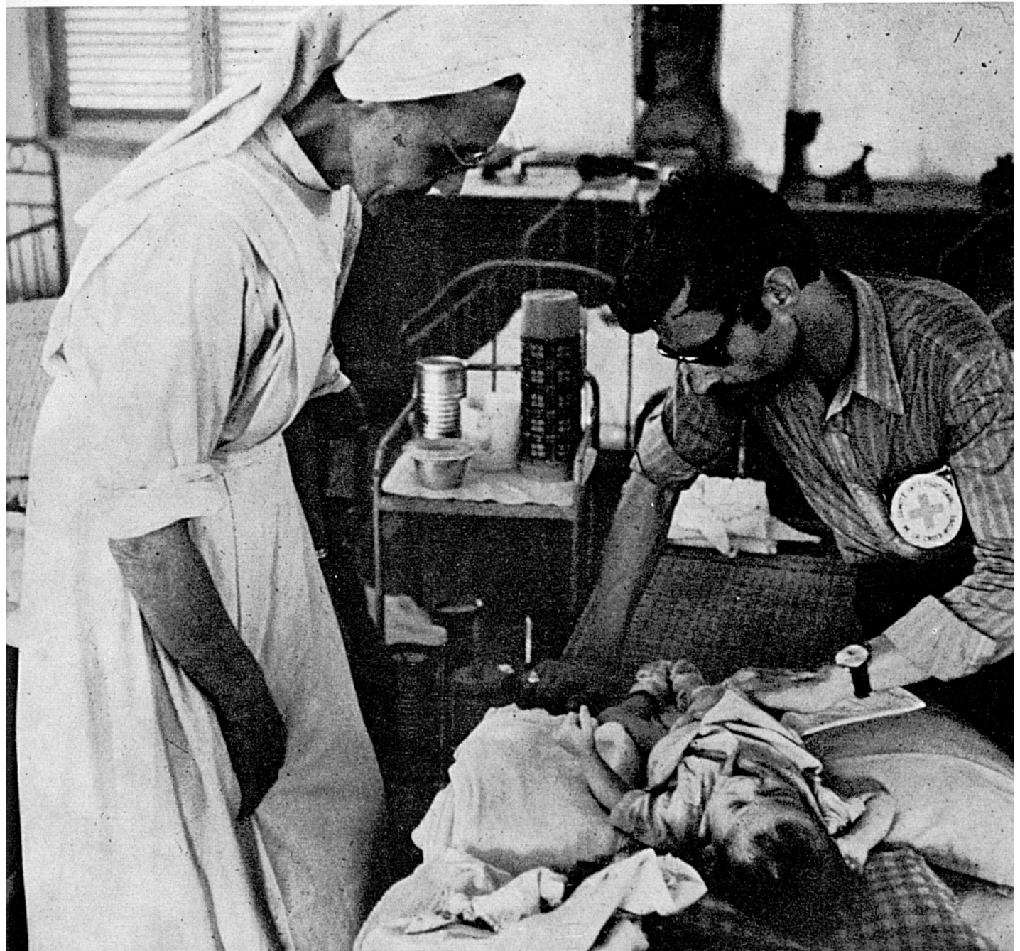
Ein Arztdelegierter des IKRK besucht ein Waisenhaus in Saigon.