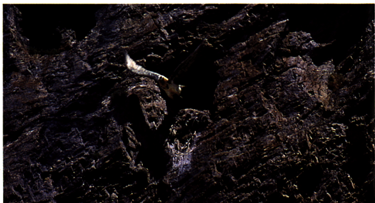
Muttervogel Jo schwingt sich aus dem Horst (12. 7. 1998). Im Juli besuchten die Altvögel nur noch sporadisch ihr Nest, meist um Beute einzutragen. Trotzdem behielten sie den Jungvogel fast ständig im Auge und übernachteten vorzugsweise in Felsnischen mit Blickkontakt zum Horst.