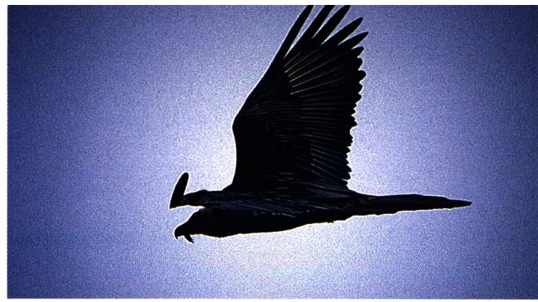
Cic, das Männchen des Zernez Paars, am 24.12.98 hoch über dem Livignosee segelnd. Hier ist die Thermik dank Felsreichtum und Seenähe besonders günstig.

tragen. Der Junggeier stand derweil am Horstrand und dachte nicht daran, den Platz auf der schmalen Plattform für den Anflug freizuhalten. Erst beim fünften Versuch klappte die Landung, der Junggeier wurde dabei unsanft weggestossen. Settschient verschwand alsbald zusammen mit dem Junggeier im Horsthintergrund, wohl um dort dem hungrigen Nachwuchs die Beute zu eröffnen und zu verfüttern.