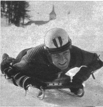
Nino Bibbia (Italien), wurde Olympia-Sie- ger im Skeleton auf dem Chresta Run.