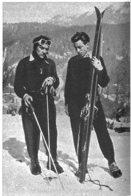
Doppelter Sieg der Franzosen.

Skeleton. Um auf einem handhohen, kurzen Schlitten durch vereiste Kanäle zu Tal zu schiessen, oft mit einer Geschwindigkeit von über 100 Stundenkilometern, dazu braucht es wohl nicht nur Mut, sondern auch viel Können und einen