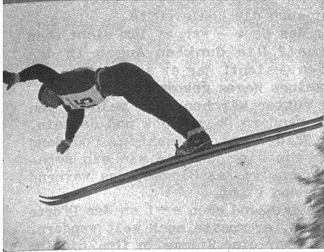
Petter Hugsted (Norwegen), prächtiger Sieger des Spezial-Sprunglaufs.