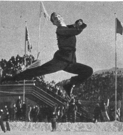
Richard Button (USA), Olympiasieger im Eiskunstlaufen!

Schweiz—Tschechoslowakei 1 : 7. Gefährli- cher Angriff der Rotjacken auf das von Modry mit Bravour gehütete tschechoslo- wakische Tor.